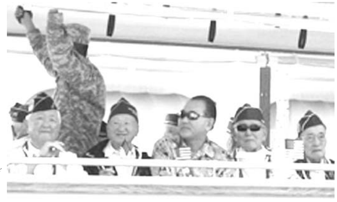
バスに乗ってパレードを行う議会名誉ゴールドメダル受勲のみなさん