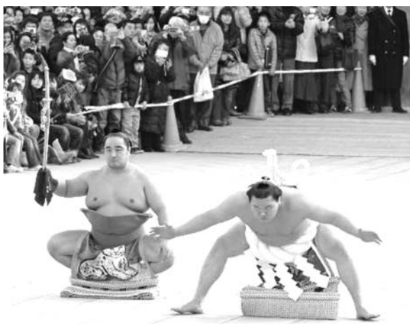
大勢の見物客の前で、奉納土俵入りをする横綱白鵬。太刀持ち安美錦

力強い不知火型 いい相撲を取りたい 巧者が相手の2日目までが肝心となる。琴奨菊は場所直前に3度の熱を出したが、本場所でも強さを発揮する。先場所は初日から9連勝の好スタートを飾った。初日の賜杯獲得には精進の強さが求められる。