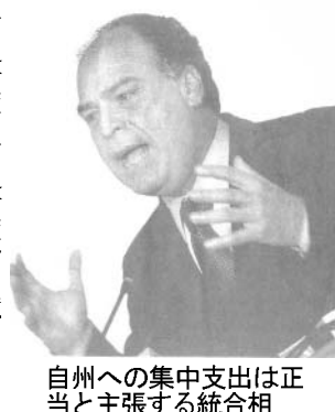
正統相の支出は中央集権の主張

統合省管轄の防災対策費は、自治省と共に管理する自然災害関連予算の一部で、2011年の場合、27億5千万レアルの予算中5億470万レアルがこれに当たると、この5億470万レアルの内、使われずに残ったのは46.6%の2億8470万レアル。5日付フォーリャ紙によれば、州や市に支出された