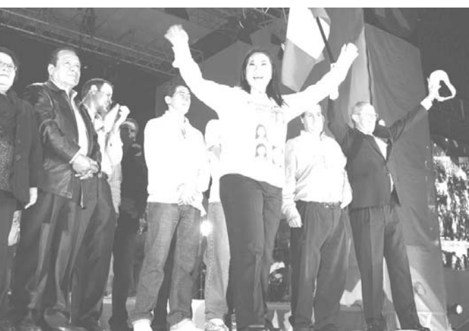
2011年6月2日、リマ中心部で支持者を前にポーズをとるケイコ・フジモリ氏

ユーロ圏の失業率10.3% 昨年11月、最悪水準続く 【ブリュッセル共同】欧州連合(EU)の統計機関ユーロスタットは6日、ユーロ圏(17カ国)の昨年11月の失業率(季節調整済み)は10.3%と発表された。EU全体(27カ国)も前月と同じ9.8%だった。財政危機の影響で欧州経済が停滞する中で各国