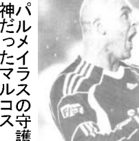
パルメイラスの守護神だったマルコス

近年のパルメイラスを代表する選手で、2002年に伯国代表(セレソ)が世界王者となった際に正GKマルコス(38)が4日に正式に引退を表明した。5日付伯国サイプレス紙が報じた。引退発表は4日午後に行われた。パルメイラスのセザール・サンパイオ理事は「マルコスは満身創痍だった」と引退の理由を語った。また、伴侶である父を失った後の母との時間が必要だと感じていることも理由とされている。一説では、今年のサンパウロ選手権までの契約更新を打診したところ、パルメイラス側との交渉が不調に終わったことにも不満を抱いたからともいわれている。マルコスは1992年5月に19歳でプロデビューして以来、20年間一貫してパルメイラスの一員としてプレーし、1999年にはリベルタドーレス杯での優勝にも貢献した。また、翌年のリベルタドーレス杯は準優勝に終わったものの、準決勝の対戦相手であるコリンチアンス戦でマルコスは見事セレソの優勝にも貢献した。その後は、大腿部の痛