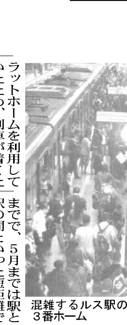
混雑するブラリス駅の3番ホーム

昨年8月以降、ブラリス駅から通っていたパウルスタ都電公社(CPTM)のトゥルケイザ10号線(リオ・グランデ・ダ・セーラ行き)の発着が、今後も継続されることとなった。17日付エスタド紙が報じた。ブラリスとパウルスタ間の運行停止は施設の交換などのためだったが、今後もブラリスを10号線の発着駅とするという決断は、文