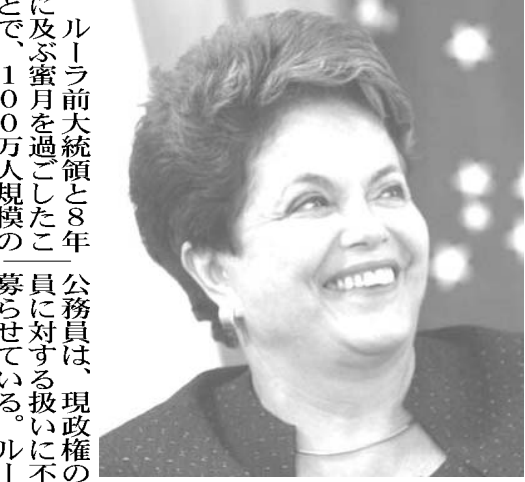
公務員のゼネストの矢面に立たされそうなジウマ大統領

権は、民政移管後では公務員給与に際して最も寛大な条件を提示した政権だったが、ジウマ・ロウゼフ大統領政権は少なくとも就任初年（さらに2012年予算）では、公務員側が給与総額にして400億レアルの引き上げを求めたのに対して実施したのはわずか16億レアルの賃上げだった。しかも、政府は2012年に新たな給与調整を実施しない前提で交渉に挑む。2007年の労使