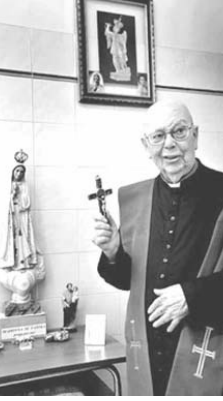
道徳的・社会的に悪魔払いの専門家として知られるナンニ。悪魔払いの儀式を行う小部屋が、天井は高い窓が少なく日中でも薄暗い。タイル張りの壁には聖人の肖像画が掛けられ、相談者が座る緑の布の肘掛け椅子が置かれている。

「典型的な悪魔つきだ。突然に外国語を話したり、さやしゃな女性や男4人で押さえ付けなければならぬほどの力で暴れることもある。悪魔つきになるのは、降霊会や悪魔崇拝の儀式に参加した人に多く、誰かに呪いを掛けられることもあると言われている。この女性も「呪いを掛けられていたが、儀式を