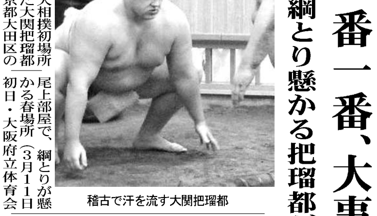
稽古で汗を流す大関把瑠都

【共同】大相撲初場所が1日、東京都大田区で初優勝した大関把瑠都が1日、東京大田区の尾上部屋で、綱とりが懸かる春場所(3月11日)の初日・大阪府立体育会館(23歳以下)による3(23歳以下)U-23(23歳以下)による5輪アジア最終予選でC組第4戦のシリア戦(2月5日・アンマン)を控える日本代表は31日、事前合宿地のドーハでイラクと非公開の練習試合に臨んだ。日本チームの出身は、誰よりも声を掛けてチームに活気を与えた。中堅にも、ベテランにも、新人にも負けないという気持ちでやっていると話した。昨季首位打者の内川聖一(外野手・29)は、大分県出身は今年から変更となった背番号「1」を初披露。存在感抜群の主軸は「打撃の感触も悪くない」とうなずいた。