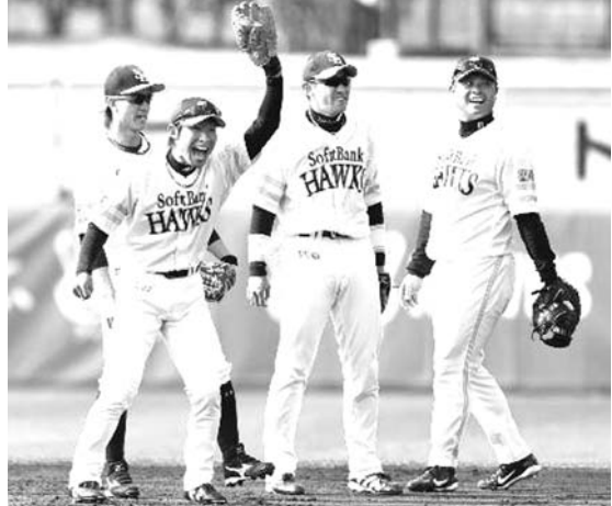
ソフトバンクが1日、宮崎市の生目の杜運動公園で1カ月間のキャンプをスタートさせた。2年連続日本一への土台作り

【共同】プロ野球の12球団が1日、宮崎、沖縄両県内でキャンプインし、新球団DeNAの中畑、中日の高木、阪神の和田、日本ハムの栗山の新監督4人が3月30日から始まる公式戦に向けてスタートを切った。 沖縄には9球団が集結し、宮崎では中畑監督が積極的に選手に声を掛け、4年連続最下位に低迷するチーム再建に着手した。栗山監督はダルビッシュの米大リーグ移籍で期待が掛かる2年目の斎藤の投球練習を熱心に見守り、高木監督と和田監督も初日から精力的に動いた。久米島町では昨季の沢村賞投手、楽天の田中が早速ブルペンに入った。 球団譲渡により7年ぶりの新球団として船出するDeNAは中畑親監督の宮崎キャンプで中畑清初代監督の下、4年連続最下位から