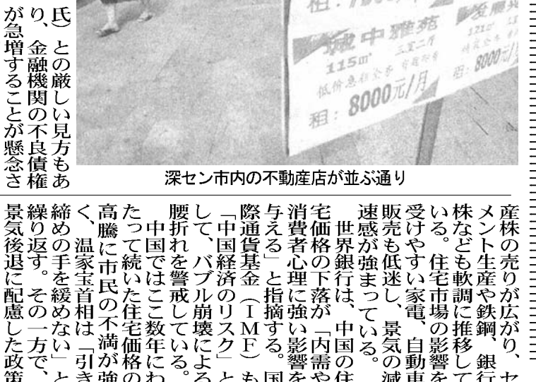
深セン市内の不動産店が並ぶ通り

深センでは昨年、8000店あった不動産店が5000店に減り、大手の中原地产は最近、深センで60店舗を閉鎖し、従業員10000人を削減する」と発表した。北京や上海でも不動産店の閉鎖が相次ぎ、各社が事業の整理を急いでいる。 国家統計局によると、昨年10月に住宅価格が前月より下落したのは主要70都市のうち、前月比で