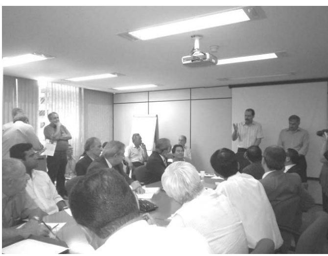
農産物以外の運送業者も集まり、会合はまたも紛糾

【既報関連】昨年12月から、聖市食料供給センター（CEAGESP、以下セアザ）に通じるマルジナル・ド・ピニエイロスとハンディランテス大通り、マルジナル・ド・チエテなどで「部の時間帯にトラックの通行が規制され、生鮮農産物の販売・購入などに携わる人々がセアザに出入りできず、営業妨害」と抗議している問題で、今月1日午前、行政側と抗議する人々との間で2回目の会合が開かれた。安部順二下議（PSD-SP）は「ジルベルト・カサビ聖市長に強く要請する」としているが、前回会合で発足した、組合員を代表し行政と交渉する委員会の代表で、モジ農協協会の森ミヨル氏は「市の方からは何も連絡がない。規制で皆遠回りしているし、大いに支障が出ている」とため息を漏らした。