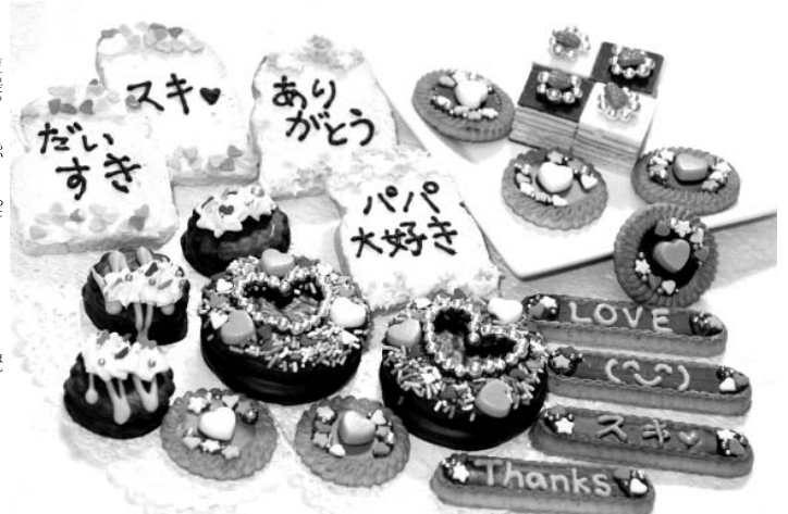
クッキーやチョコパイ、ラスクにメッセージや思い思いのトッピングをした手作りスイーツ

【共同】愛を伝える「正統派」から「義理チョコ」まで、バレンタインのチョコもいろいろあるが、昨今、定番としてきたのが「友チョコ」だ。でも友チョコを作る子どもとその親は毎年、アイディアをひねり出すのに「苦労」だらう。手作りにこだわりたいが、数もたくさん必要だからだ。市販のお菓子をちよつとアレンジするだけのレ