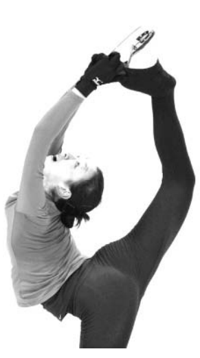
公式練習で調整する浅田真央

【コロラドスプリングズ(米コロラド州)共同】フィギュアスケートの四大大陸選手権は9日(日本時間10日)午前、米コロラド州コロラドスプリングズで開幕した。公式練習が8日に行われ、初練習した日本女子のエース、浅田真央(中大)は2回の練習でトリプルアクセル(3回転半ジャンプ)を着氷した。