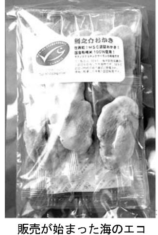
「海のエコラベル」は、資源管理対策や環境保全対策をきちんと取っているかどうかを専門機関が審査し、一定の基準を満たしていることを認め、漁獲物に特定のラベルをつけて売ることだ。

【共同】マグロやタラ、ウナギなど人間にとって重要な漁業資源の減少が止まらない。国連食糧農業機関（FAO）によると、捕りすぎの状態に陥りつつある資源は全体の32%に上り、50%は許容限度ぎりぎりまで漁獲されている。解決策として注目されているのが「乱獲とは無縁な漁業」などの専門家の「お墨付き」を漁業者に与え、特定のラベルをつけて売ることだ。海のエコラベルだ。海洋資源を守る手段として各国に広がりはじめた。