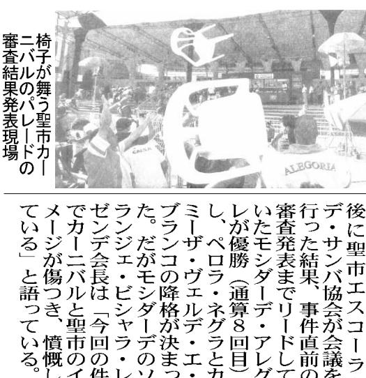
椅子が舞う聖子カーニバルのパレードの審査結果発表現場

聖子カーニバルで、スベヤルグループの審査結果発表の際、判定に逆上したエスコラのメンバーがステージに乱入し、投票用紙を強奪して破ったのをきっかけに暴行が起きるといわれている。聖子カーニバル史上、前代未聞の事件が起きた。22日付フォーリーヤ紙が報じている。 21日午後5時30分頃、聖子北部アエニエのサンボドロモでスベヤルグループのパレードの審査結果発表中、スベヤルグループの審査員と2人の審査員の採点発表を強奪した時点で、インペリオ・デ・カーザ・ヴェルデのメンバーが連営ブリスに乱入し、司会者を襲って投票用紙を強奪し、破りながら逃走した。すると、これに便乗してヴァイ・ヴァイ、カミーザ・ヴェルデ、エ・ブランコ、ガヴィオン、ス・ダ・フェイエル、エ・ステージに乱入し、トローフィーを破壊し、椅子を投げつけるなどの暴力行為を働いた。 さらに興奮したガヴィオン・エ・ステージのメンバーが、サンボドロモ脇のマルジュナル・ド・チエテに乗り出し、車の通行妨害やガソリンスタンドでの商品強奪を行った。この間、会場に停めてあったペロラ・ネグラの2番目と5番目の山車に放火。ペロラ・ネグラのメンバーが約15分後に到着した消防と消火した。この騒ぎで、最初この騒ぎをみたインペリに乱入を試みたインペリ