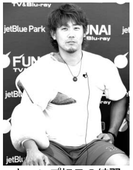
練習に集中する松坂大輔(左)とホルン

【サブライズ(米アリゾナ州)共同】米大リーグは21日、レンジャーズのダルビッシュ有投手がアリゾナ州サブライズのキャンプ地で初めてチームに合流して練習を行った。ブルペンで約30球を投げ、23日に始まるバッテリー組のキャンプインに備えた。 練習後、レンジャーズのワシントン監督は「低め、低めに投げていたし、心地よい投球だった」と、ダルビッシュのブルペンでの投球をうれしそうに振り返った。非公開とされたキャンプ地に入ってから練習は、周囲の好意的な評価ばかりを集めた。 ブルペンで受けた若手捕手によると、7、8割の力で約30球を投げ、カットボールや落ちる球