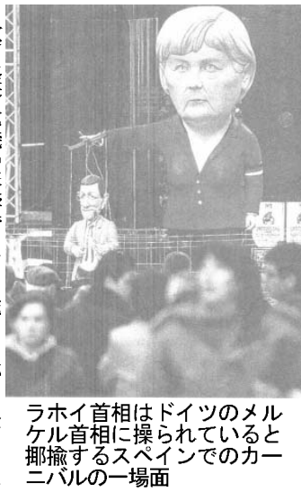
メルとカーの伯人不動産ブーム

伯国でも経済減速化がおり始めた11年8月、北東伯は6%の経済成長を記録した。ところが12月末の北東伯の経済成長率は約2%ポイント下がり4.4%。全国平均の2.7%や、11月までの南東伯の4.1%を上回っているが、北東伯の経済成長は、北東伯も、危機の影響を免れきれなかった。米国のサブプライムショックやリーマンショックを発端とする世界的な金融危機が、早くも北東伯に波及している。今回の欧州経済危機の影響で、年5%以上が目標だった11年の経済成長