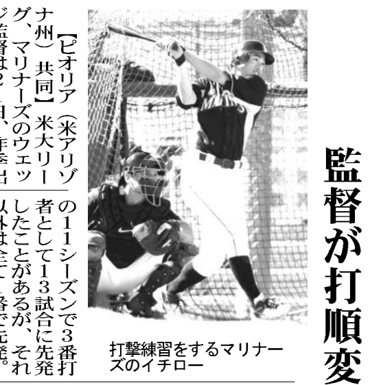
練習をするイチロー