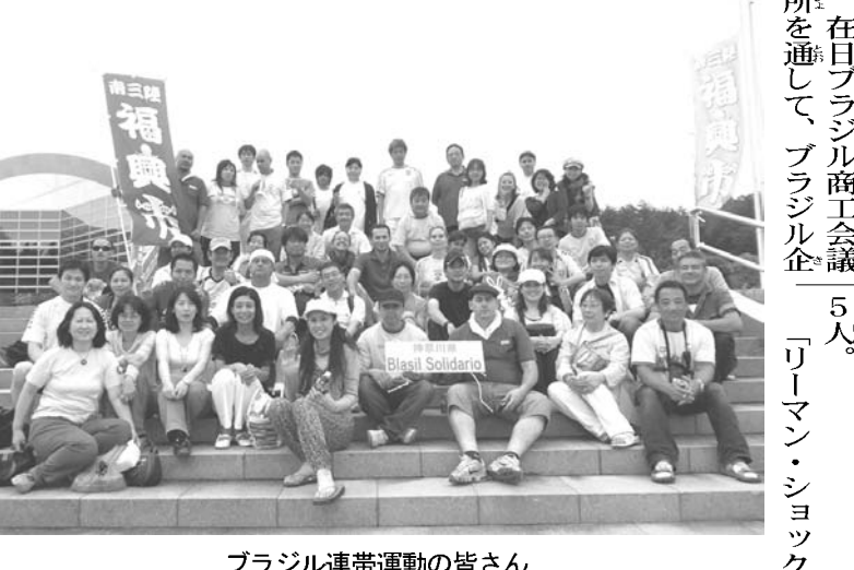
ブラジル連帯運動の皆さん

の生徒らによるパフォーマンス、シユラスコで被災者を元気づけた。在日ブラジル商工会議所を通して、ブラジル企業 「生徒らによるパフォーマンス、シユラスコで被災者を元気づけた。在日ブラジル商工会議所を通して、ブラジル企業