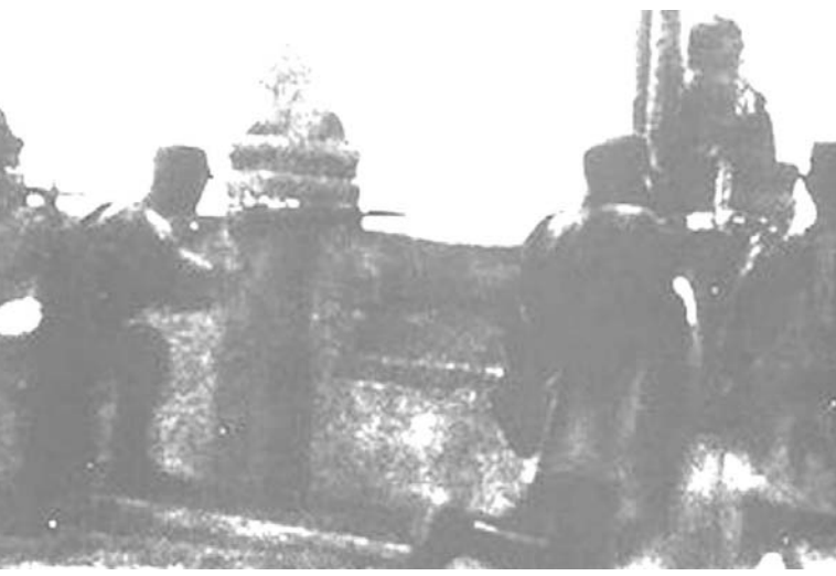
盧溝橋の国民革命軍部隊

まず東京書籍から見てみよう。「なぜ歴史を学ぶのか」について、直接的に述べているのは、わずか3分の1ページほどである。