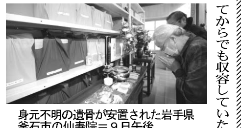
身元不明の遺骨が安置された岩手県釜石市の仙寿院=9日午後

【共同】東日本大震災は11日で発生から1年を迎える。犠牲者は1万5854人、行方不明は3167人だ。徐々にならぬ人も依然として3167人。捜索活動は難航を極めており、肉親と対面できない家族にとっては、苦しみを抱え続けた日々が続く。 1カ月ごとの遺体発見数は見ると、昨年4月は1万1441人、3月は3257人だった。徐々に発見は減り、12月には1人、2月も9人だけになった。一方、警察はDNA鑑定を進め、今年に入っ