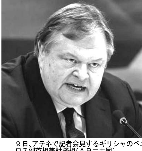
9日、アテネで記者会見するギリシャのベニゼロス副首相兼財務相（AP=共同）

【共同】東日本大震災は11日で発生から1年を迎える。犠牲者は1万5854人、行方不明は3167人だ。徐々にならぬ人も依然として3167人。捜索活動は難航を極めており、肉親と対面できない家族にとっては、苦しみを抱え続けた日々が続く。 1カ月ごとの遺体発見数は見ると、昨年4月は1万1441人、3月は3257人だった。徐々に発見は減り、12月には1人、2月も9人だけになった。一方、警察はDNA鑑定を進め、今年に入っ