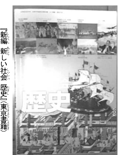
『新編 新しい社会 歴史』(東京書籍)