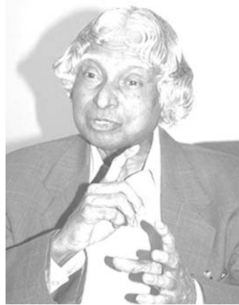
ニューデリーの事務所で語るアブドル・カラム前インド大統領

●「明日の大国」インドの科学、政治の指導者として大震災と福島原発の事故に何を思いますか。