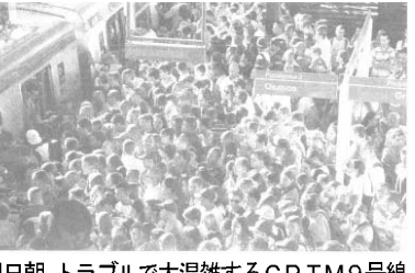
14日朝、トラブルで大混雑するCPTM9号線

地下鉄の発表によると、16万5千人の足に影響が出たという。だが、この日はこれで終わらなかつた。15日、40分は地下鉄2号線システムで空気圧縮システムに異常。また、19時40分にはCPTM9号線は、地下鉄4号線開通の影響で利用者が増え、2011年2月より減らされている。