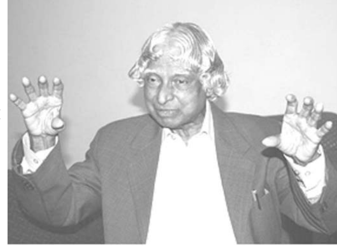
ニューデリーの事務所で語るアブドル・カラム前インド大統領

「世界各国が成長するにつれてエネルギー需要は確実に増す。米国の1人当たりの電力消費は日本の2倍、中国の6倍。そしてインドの15倍。今後の成長や化石燃料の枯渇の可能性、気候温暖化の問題を考えると、新しいエネルギー源を早急に増やさねばならぬ。それは太陽光、風力、バイオ燃料、原子力、トリウム炉や核融合炉も考えられ、原子力は有力なエネルギー源であり続ける」