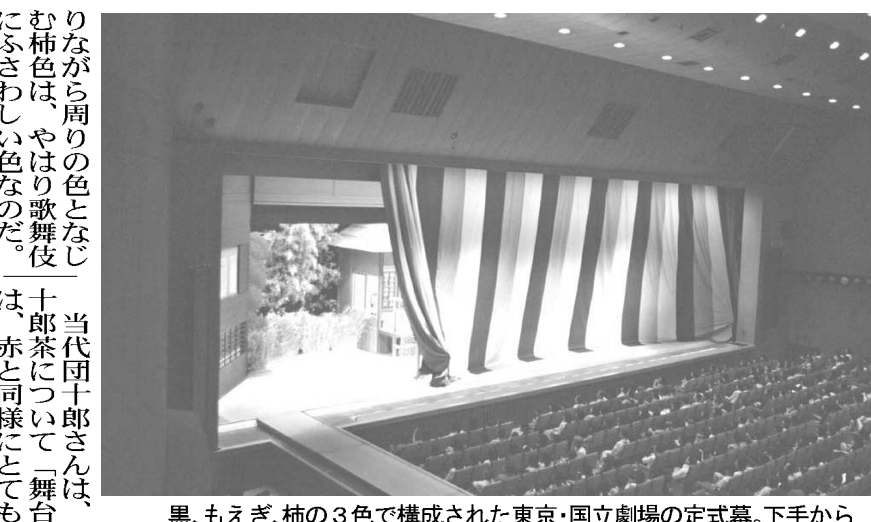
黒、もえぎ、柿の3色で構成された東京・国立劇場の定式幕。下手から上手へ幕が引かれ、芝居の世界が広がる

「日本では『脱原発』の考えが広がっている。米国の1人当たりの電力消費は日本の2倍、中国の6倍。そしてインドの15倍。今後の成長や化石燃料の枯渇の可能性、気候温暖化の問題を考えると、新しいエネルギー源を早急に増やさねばならぬ。それは太陽光、風力、バイオ燃料、原子力、トリウム炉や核融合炉も考えられ、原子力は有力なエネルギー源であり続ける」