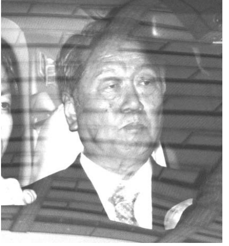
陸山会公判が結審し、東京地裁を出る民主党元代表小沢一郎=19日午後3時8分

【共同】資金管理団体「陸山会」の土地購入をめぐる収支報告書偽造記入事件で、政治資金規正法違反で強制起訴された民主党元代表小沢一郎被告（69）の第16回公判が19日、東京地裁（大善文裁判長）であり、元代表は「いかなる点でも罪に問われる理由はなく、私は無罪だ」とあらためて主張し、結審した。検察側の指定弁護士は9日、禁錮3年を求刑しており、判決日時は4月26日午前10時に指定された。元代表は最終意見陳述で「検察は捏造した違法不当な供述調書と有罪ありきの捜査報告書を検察審査会に提供して起訴議決を強力で誘導した。政治への介入で、議会制民主主義を破壊し、国民の主権を冒犯、侵害した暴挙だ」と批判した。