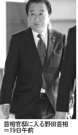
首相官邸に入る野田首相=19日午前

【共同】民主党は19日午後、社会保障と税の一体改革に関する合同会議「役員会」で消費増税の閣内法案の修正を協議。法案付則「再増税削減」から法制化時期を削除する方向で一致した。景気条項には経済成長率などを盛り込むが、税率引き上げ停止の「条件」とはしないことも確認した。政府側と調整を