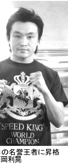
WB Cの名誉王者に昇格した西岡利晃