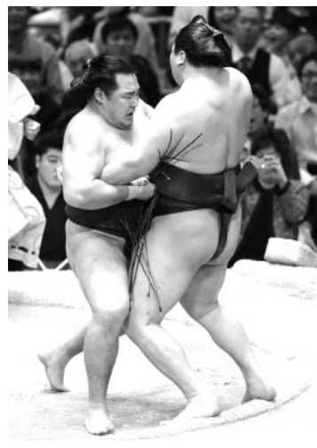
鶴竜が寄り切りで白鵬を破る