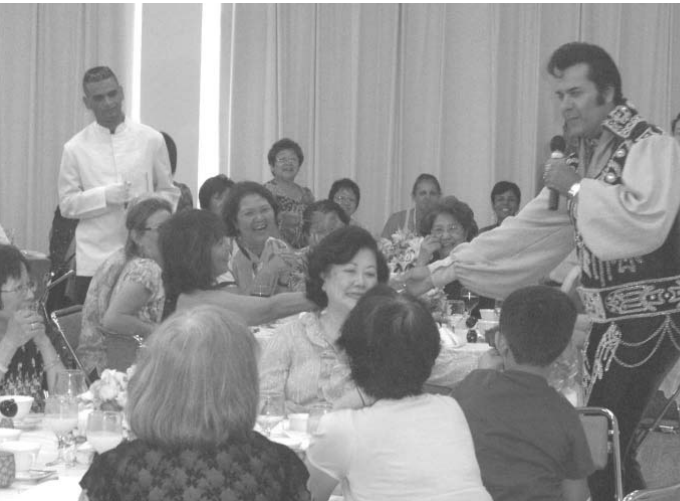
エルデルさんのショーで大賑わいの会場

希望の家福祉協会(上)の今年も豪華に慈善お茶会。収益金は約3万2千円は運営費に充てられた。