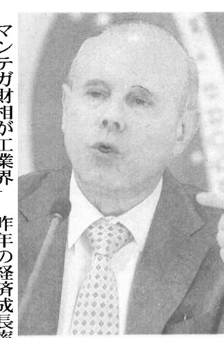
マンテガ財相は次々に工業界向け減税策を発表するが...

フオゴン、洗濯機などを対象とする減税処置の6月までの延長と3部門への減税拡大だ。具体的には、家具や床材の工業製品税(IPI)は免除し、壁紙への課税率は20%を10%、照明器具は15%を5%に各々軽減する。