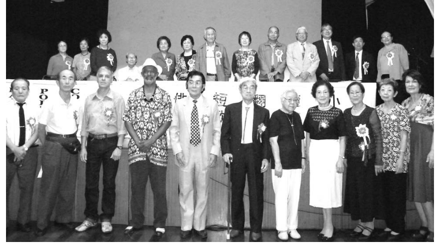
前列が受賞者のみなさん、後列が選考委員や役員ら