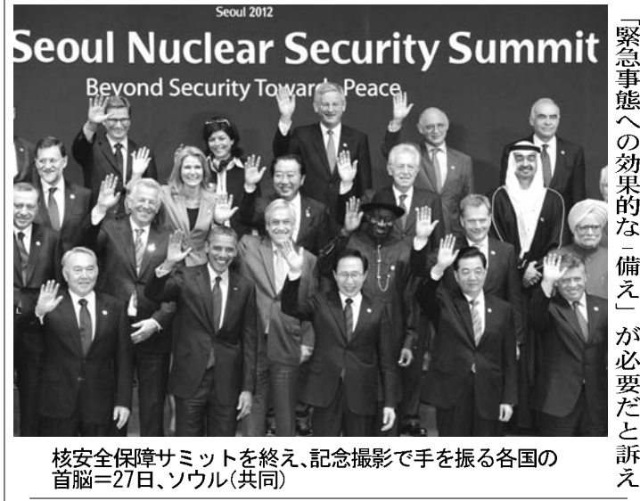
核安保サミットを終え、記念撮影で手を振る各国の首脳＝27日、ソウル

原発安全強化で一致 第2回核安保サミット閉幕 【ソウル共同】核テロ防止策を協議したソウルでの第2回核安保サミットは27日、東京電力福島第1原発事故の教訓を踏まえた原子力施設の安全対策強化で一致。核兵器への転用が可能な高濃縮ウランの使用最小化に向けた一層の取り組みなどを参加国に求めた共同宣言「ソウル・コミニケ」を採択、閉幕した。 議長を務めた韓国の李明博大統領は閉幕後の記者会見で、参加国のうちウクライナやメキシコなど8カ国が過去2年間に高濃縮ウラン計480キロを廃棄したり、米国やロシアに移送したり米やアジアに移送し、核テロに成果があったと強調した。コミニケは北朝鮮と最大の脅威の一つであり、国際安全保障にとって「国際安全保障にとって最大の脅威の一つであり、