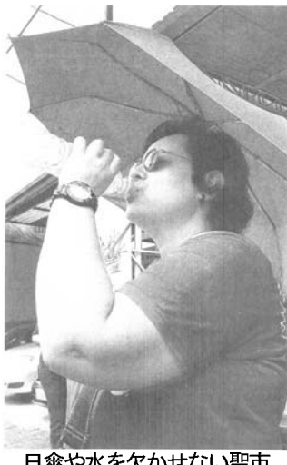
日傘や水を欠かせない聖市 東部イタイン・パウリス

サンパウロ州立大学(Unesp)とアメリカ航空宇宙局(NASA)が行った調査によると、聖市では東部やセントロの気温が高い地域と南部や北部の気温が低い地域との温度差が1.4度に及び、ヒートアイランド現象が進んでいると26日付エクスタード紙が報じた。