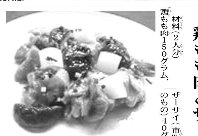
鶏もも肉とザーサイの蒸し物

材料(2人分) 鶏もも肉150グラム ザーサイ(市販の味付きのもの)40グラム 生シイタケ2枚