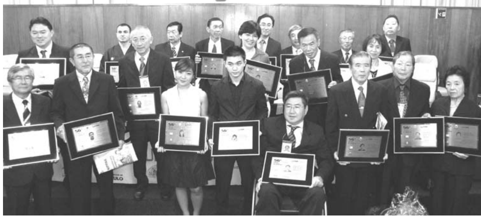
記念プレートを受け取った受賞者のみなさん

スポーツ振興を目的に本紙が主催し、各スポーツ界で活躍した選手や功労者を表彰する『パウリスタスポーツ賞』の贈呈式が4日夜、聖市議会の貴賓室で盛大に開催された。同賞は本紙の前身であるパウリスタ新聞の創刊10周年を記念して創設され、今年で56回目を迎える日系社会有数の伝統行事で、今年初めて聖市議会で開かれた。ゲートボール、剣道、卓球、柔道、相撲など全16部門から、各連盟やクラブの推薦により選出された17人及び、他に3人が特別賞を受賞した。会場には受賞者の親族や関係者ら約400人が訪れ、受賞者の輝かしい経歴を称え前途を祝った。