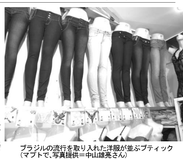
ブラジルの流行を取り入れた洋服が並ぶブティック(マプトで、写真提供=中山雄亮さん)

【共同】ソフトバンクが傘下のプロ野球ソフトバンクホークスの本拠地ヤフードームを買い取る。3月24日に発表された。870億円という巨額の買収額は、チームの戦力強化や球団が掲げる「地域密着」にも好影響を与えそうだ。