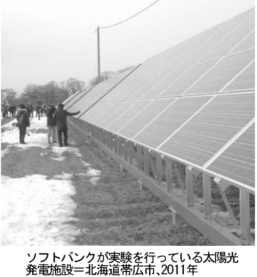
ソフトバンクが実験を行っている太陽光発電施設＝北海道帯広市、2011年

【共同】ソフトバンクが北海道小牧市の東部に大規模太陽光発電施設（メガソーラー）の建設を計画していることが4日分かった。出力は少なくとも20万キロワット級になるとみられ、現すれば国内では最大、世界でも有数の規模になる。7月から「固定価格買取取り制度」が導入され、電力会社が太陽光や風力など再生可能エネルギーによる電力買い取りを始める。政府が設定する買い取り価格によっては、大規模な発電設備建設の動きが全国に波及する可能性もある。