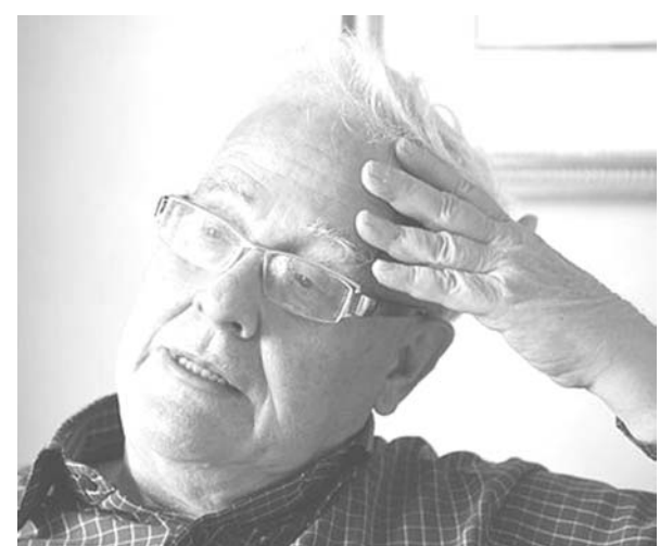
インタビューに応じる政治学者のベネディクト・アンダーソン氏

リズムは子ども、つまり将来を大事にする ●ハリケーンが襲ったニューオーリンズでは略奪もあった 「ニューオーリンズでは黒人が人間として扱われなかった長い歴史と白人と黒人の対立があり、それが今も原因となっている。今日本では事情が異なる。日本でも関東大震災では朝鮮半島出身者が多数殺害されたが、今はそういふことはまったく起きていない」