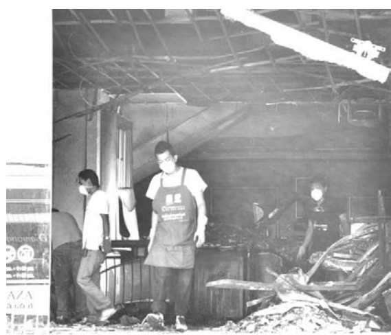
商業都市ハジャイの爆発は市民をパニックに陥れた。後片付けに追われる人々

【共同】「ほほ笑みの国」と呼ばれる仏教国タイの南部で、分離独立を求めるイスラム武装勢力による爆弾テロが後を絶たない。背景にあるのは、かつてイスラム王国が栄えた歴史。テロが激化した2004年以降の死者は5千人超に上るが、タイ政府は、他地域への飛び火を恐れて独立は認めない方針で、解決の兆しは見えない。