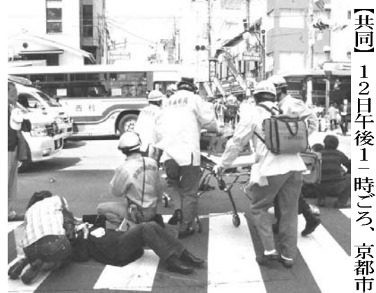
【共同】12日午後1時ごろ、京都市東山区の繁華街祇園の交差点に軽ワゴン車が突つ込み、歩行者を巻き込み、8人死亡、11人負傷。乗車していた軽ワゴン車の運転手は、衝突直後に死亡したと見られる。

【共同】12日午後1時ごろ、京都市東山区の繁華街祇園の交差点に軽ワゴン車が突つ込み、歩行者を巻き込み、8人死亡、11人負傷。乗車していた軽ワゴン車の運転手は、衝突直後に死亡したと見られる。府警によると、死亡したのは、11人が負傷した。府警によると、死亡したのは、11人が負傷した。府警によると、死亡したのは、11人が負傷した。