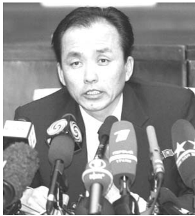
長距離ミサイルの打ち上げを予告した北朝鮮の衛星打ち上げに関する記者会見。北朝鮮の衛星打ち上げに関する記者会見。北朝鮮の衛星打ち上げに関する記者会見。

【共同】北朝鮮が長距離弾道ミサイルとみられる「衛星」打ち上げを予告した12〜16日、東シナ海の飛行ルート周辺で、航空会社や船舶会社が「不測の事態」に備える動きを強めている。沖繩への修学旅行延期や、体育の授業を室内に切り替える動きも出ており、地元では「早く終わって」とうんざりしたムードが広がっている。