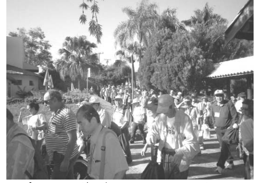
ピラチニガ温泉でフレッシュした一行

入ってみると広々とした施設は緑があふれ、朝の爽やかな空気がすがすがしい。プールのほか、テニスやバスケットコート、遊歩道などもある。椰子の木が両脇に並ぶ道を歩きながら、一行は