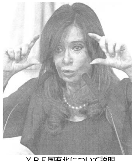
YPF国有化について説明するクリスティーナ大統領

最大株主だったレブソル社が大打撃を被る事に業を煮やしたスペインは、外務相らにラ米各国に送るなどして国際世論を取り込もうと画策中。その一方、国内でも石油採掘を行い、一時はシェアを12%まで上げたものの、現在は8%に落ちているペトロブラスの扱いが気になっていたのが伯国側だ。YPFの国有化は国内の問題として、干渉を避ける姿勢に終始。メルコスル内の経済大国で外交や貿易でも密接な関係を保ってきた伯国が、伯国企業の国有化を言い出す事はないと