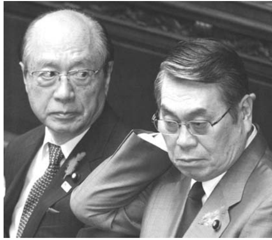
参院本会議で問責決議が可決された自民党防衛相（左）田中直紀と国交相の前田武志（右）

【共同】自民党などが提出した田中直紀防衛相と前田武志国交相に対する問責決議は20日の参院本会議で、それぞれ野党賛成多数により可決された。