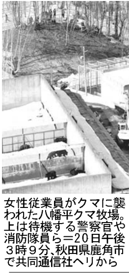
クマに襲われ2人死亡した現場の様子

【ワシントン共同】日米欧の先進国に中国やブラジルなどの新興国を加えた20カ国・地域(G20)財務相・中央銀行総長会議が19日夜(日本時間20日朝)、ワシントンで開幕した。