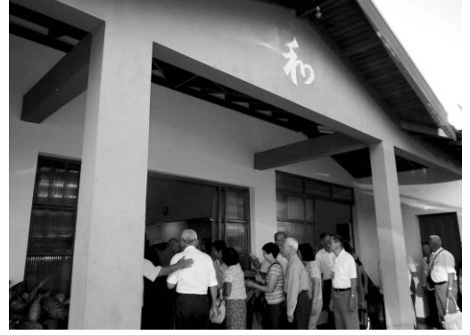
パパウリスタ文協会館入り口で出迎えを受けた