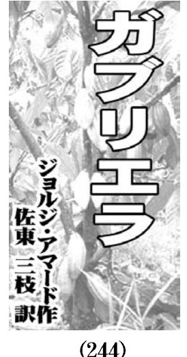
ガブリエラ 佐東三枝 訳 (244)

聖州カリオ、たまにバリエアというのがある。だが、マリニョン州サンリスという有名な場所。世界的に有名なバリエア・メタル音楽のバンドが集まった「メタル・フェスティバル」が20日から3日間の予定で開催中だ。だが、初日から4時間の開始遅れに4パンがキャンセルという非常事態。大丈夫か。