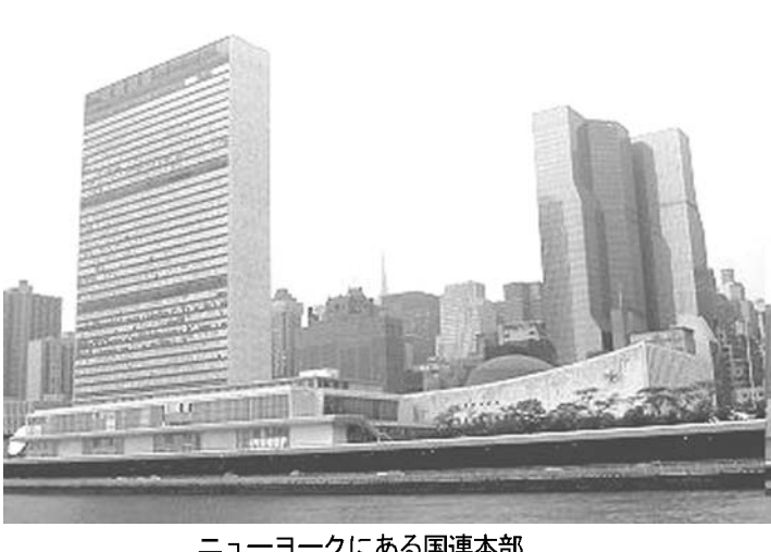
ニューヨークにある国連本部

【共同】総務省が17日発表した2011年10月1日時点の人口推計。総務省は「出生者が出生者より18万人多く、震災で外国人の出国者が10万2千人、減少した」とみている。