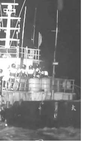
不法操業中の中国漁船を取り締まる韓国海洋警察