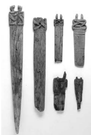
青森県八戸市の川中居遺跡（縄文時代晩期）の木製品

【共同】青森県八戸市にある紀元前1000年ごろ（縄文時代晩期）の川中居遺跡から出土した木製品が、現存する世界最古の弦楽器の可能性があると、弘前学院大（青森県弘前市）の鈴木克彦講師（考古学）らの研究で28日までに分かった。