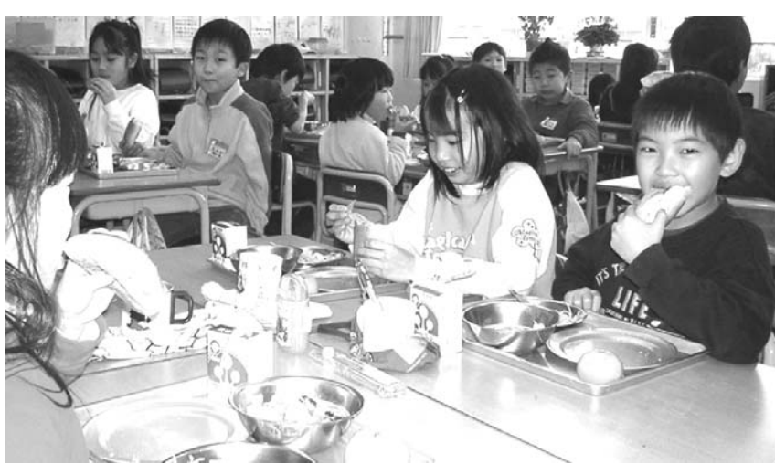
「給食の時間」で食事のマナーなどを身につける

【共同】学校給食を実施する全国の公立小中学校で2010年度、給食費を納めていない子どもの割合は09年度より0.2ポイント減の1.0%で、未納者が在籍する学校の割合も4.3ポイント減の51.1%だったことがこのほど、文科省の調査で分かった。