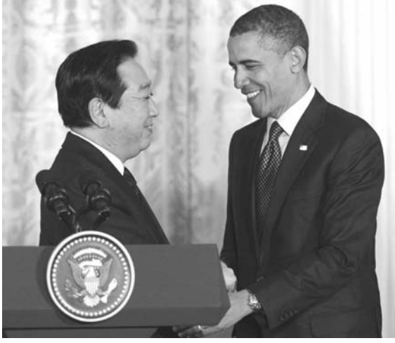
記者会見を終え、握手する野田首相とオバマ大統領。4月30日、ワシントンのホワイトハウス

【ワシントン共同】野田佳彦首相は30日、オバマ大統領とワシントンのホワイトハウスで会談した。両首脳は会談後、日米同盟の新たな指針として海上安全保障・経済分野のルールづくり促進や、警戒監視活動をめぐる自衛隊と米軍の協力強化を柱とする共同声明「未来に向けた共通ビジョン」を発表。急速な経済発展に伴い軍事面でも台頭する中国をにらみ、アジア太平洋地域の安定と繁栄に向けた同盟の再構築を図る。日米首脳レベルの共同声明は小泉政権時代の2006年以来で、鳩山政権以後は初めて。