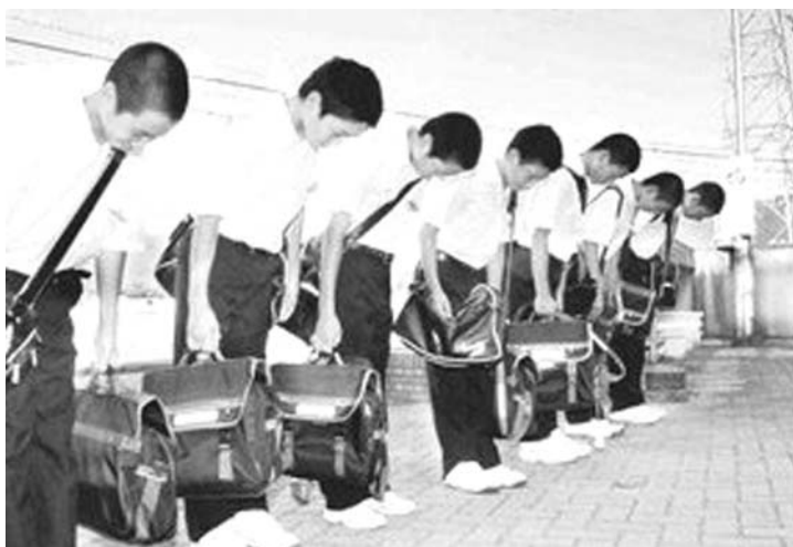
校門での一礼の伝統を始めた上志比中学校

※これを読めば自然に、日本の文化や歴史に関心をもてるような話を毎週掲載しています。より多くの二世の方や日本語学習者に読んでもらい、少しでも日本に興味を持ってもらえるよう、最寄りの日本語学校や日系団体の掲示板に張ったり、普段は邦字紙を読んでいない兄弟や子や孫などに記事を紹介してください。(ニッケイ新聞編集部)