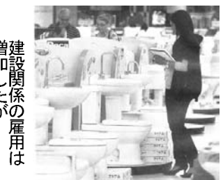
建設関係の雇用は増加したが

失業率は6.2%から6%に落ち、雇用状況は悪くないが、ローンなどの返済が90日以上遅れる債務不履行が3月の5.7%より上昇、15日以上の90日未満の遅れも8.5%という数字は、政府の消費促進策の限界を感じさせる。債務不履行は個人レベルの方が多く、3月の7.4%が7.6%に上昇。企業向けの融資に関する債務不履行は、3月4月とも4.1%で変わりがなかった。債務不履行は融資目的によっても発生率が異なる。車やバイク購入に伴う債務不履行は、3月の5.7%が5.9%に上昇。また、銀行などから個人融資での債務不履行は5.3%が5.5%に、家などの資産獲得のための融資での債務不履行は12.9%が13.4%に増えた。唯一の例外は特別小切手で、10.6%だった債務不履行が10%に減った。