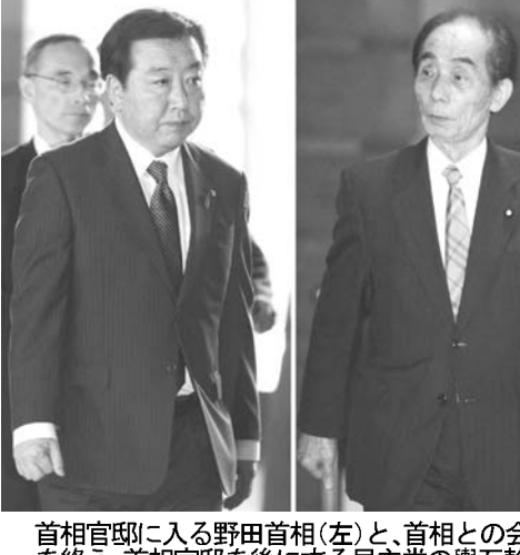
首相野田佳彦（左）と野田幹事長（右）の会談の様子。野田首相は採決日程の明示を指示した。