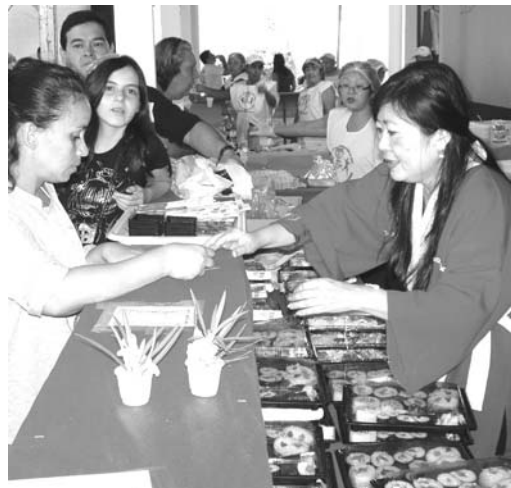
販売に大忙しのカウンター

レジストロ市恒例の『寿司祭り』が2、3の両日、RBC(同市ベイスボール・クラブ)体育館で開催され、約3千人が訪れ大いに賑わった。同市文協、RBC、同市役所共催。