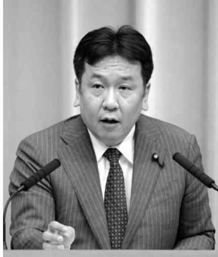
TPPで多忙な枝野幸男経済産業相

【ワシントン共同】ロシア・カザンで開かれたアジア太平洋経済協力会議（APEC）に合わせ、枝野幸男経済産業相は環太平洋連携協定（TPP）交渉に参加する関係国と相次いで会談した。交渉入りには事前に関係国の承認が必要だが、米大統領選の駆け引きに使われているとの見方を強めている。要求の「本気度」が見えず、日本はいらだちを募らせている。枝野氏は4、5日の会期中、計5カ国のTPP関係国と個別に会談した。米国のカーン通商代表とは1時間ほど話し、関係者によると大半をTPPに費やした。