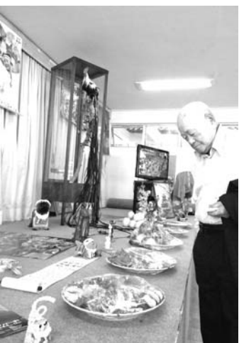
皿鉢料理などの展示に見入る来場者の男性