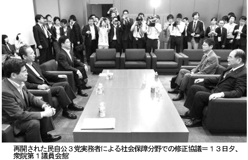
再開された自公3党実務者による社会保障分野での修正協議＝13日夕、衆院第1議員会館

【共同】自民、公明3党は13日、消費税増税を柱とする社会保障と税の一体改革関連7法案の修正で大筋合意した。焦点は、7法案とは別に自民党が成立を強く求める対案の「社会保障制度改革基本法案」の扱い。野田佳彦首相は合意に向け、民主党の考えを加えて対案を修正した上で共同提出するよう調整を指示した。一方、民主党内会では税制分野の修正状況に増税反対派から異論が噴出した。社会保障分野については3党の実務者が断続的に協議。民主党は、幼稚園と保育所を一体化させた「総合こども園」創設の撤回など譲歩した。低所得者への年金加算をめぐり調整が残っている。 【共同】自民、公明3党は13日、消費税増税を柱とする社会保障と税の一体改革関連7法案の修正で大筋合意した。焦点は、7法案とは別に自民党が成立を強く求める対案の「社会保障制度改革基本法案」の扱い。野田佳彦首相は合意に向け、民主党の考えを加えて対案を修正した上で共同提出するよう調整を指示した。一方、民主党内会では税制分野の修正状況に増税反対派から異論が噴出した。社会保障分野については3党の実務者が断続的に協議。民主党は、幼稚園と保育所を一体化させた「総合こども園」創設の撤回など譲歩した。低所得者への年金加算をめぐり調整が残っている。