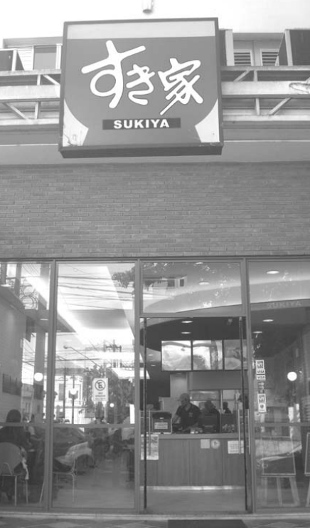
ブラジル「すき家」1号店(ヴェルゲイロ店)はサンジョアキン駅前にある

「森」うちの戦略で一番成功したのがアメリカ。そういう意味では、色んな意味で基準になっている。アメリカの人口が今大体3億人で、ブラジルは約2億人。人口比は3対2なんですけども、醤油の使用量は10対1。ブラジルはそのレベル。うちだけじゃなく、現地メーカーも入れている。まだマイナーですが、醤油の色んなものを使われるようになったとはいえ、明らかに日本食から出ている。間口を広げるためには、やっぱりブラジル人、イタリヤ、ドイツ系、日本文化