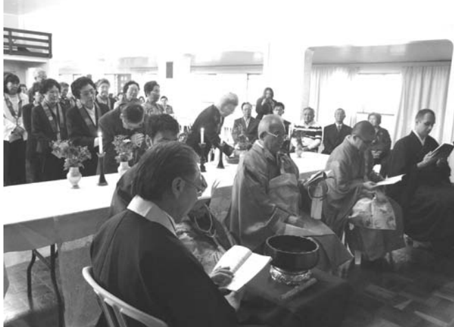
焼香をあげる来場者