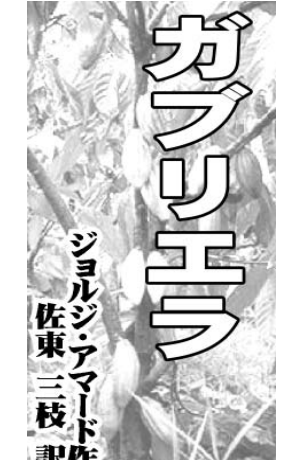
ジョルジニア・マドレーラ 佐東三枝 訳

伐採は減ったがゴミ増える。ブラジルの原生林は、過去数十年で38%減少した。一方で、都市部のゴミ問題は深刻化している。ゴミの排出量は増加しており、環境汚染が懸念されている。