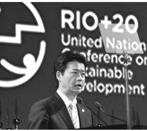
リオで演説する玄葉外務大臣