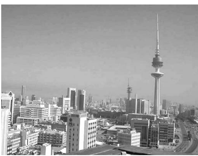
クウエートシティ街

首都クウエート市の幹線道路沿い。大型商業ビルが並ぶ中、ベスト電器の看板が目立つ。家電量販店としては同国最大の約6500平方メートルを誇る売り場で、全身を黒衣で包んだ女性スタッフが買物を楽しんでいた。