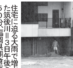
住宅に迫る大雨で増水した福岡県朝倉市

【共同】国公私立大の750大学の学長が回答した。学長が学業に不十分だと考えていることが3日、文部科学省のアンケートで分かった。学