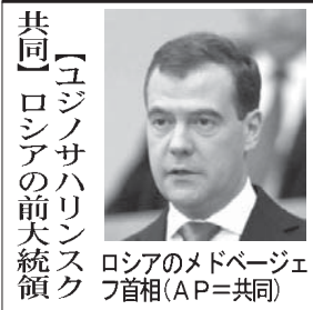
ロシアのメドベージェフ首相

メドベージェフ首相と複数の閣僚が3日午後、北方領土の国後島を訪問した。メドベージェフ氏の北方領土訪問は、大統領当時の2010年11月にロシアの国家元首として初めて国後島を訪問して初めて国後島を訪問した。日ロ関係が冷たく化して以来、北方四島返還を求め、日本政府は反発し、外務省の佐々江賢一郎事務次官は3日、ロシアのアフアナシエフ駐日大使を外務省に呼び、日本政府として受け入れられてはならない、極めて遺憾だ」と抗議した。5月に大統領に復帰した最高実力者プーチン氏の承の下での訪問は確実。ロシアとしては北方領土の実効支配をあらためて誇示し、「プーチン