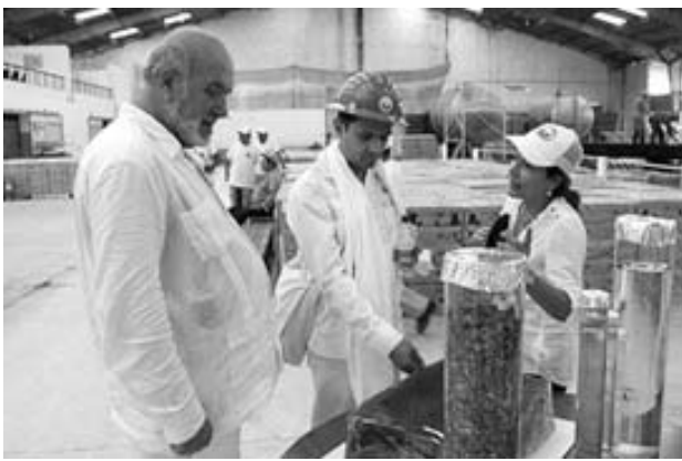
「ガビオタス」の住民らと話しかけるルガリ(右)。ガビオタスでは、最先端の環境技術が駆使されている。左から、ガビオタスの創設者パオロ・ルガリ、ガビオタスの住民らと話しかけるルガリ、ガビオタスの住民らと話しかけるルガリ。

だが、ガビオタスの風景は周囲と違う。微風でも回る飛行機の翼のような羽根が付いた小型風車。地下約40メートルから純度の高い水をくみ上げる家庭用ソーラー建物。太陽光パネルは弱い光でも水を湯や飲用に使える。