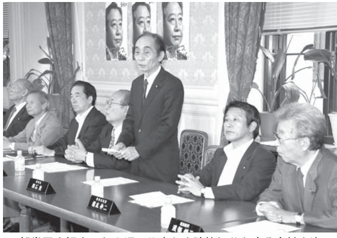
離党届を提出した小沢元代表らを除名処分する方針を決めた民主党の常任幹事会(中央) = 3日午後、国会

【共同】民主党は3日午後、常任幹事会を開き、消費増税法案の衆議院採決で反対し離党届を出した小沢一郎元代表ら衆議院37人を除名(除名)処分とする方針を決めた。同日、離党届を出した参院12人については、また参院で増税法案が採決されない限りとして離党を承認する形にした。一方、小沢氏と支持グループ幹部は、近く結成する新党の党首に小沢氏が就く方針を確認した。民主党は、法案に反対しながらも党にとどまる鳩山由紀夫元首相は党員資格停止9月1日とした。野田佳彦首相は処分を終え、参院での増税法案の審議を急ぎたい考えだ。