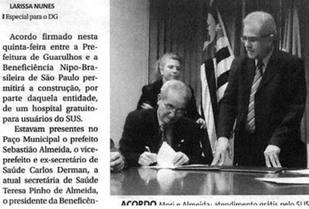
Acordão: Mozi e Almeida.

Entidade investirá R$ 20 milhões com apoio da Prefeitura