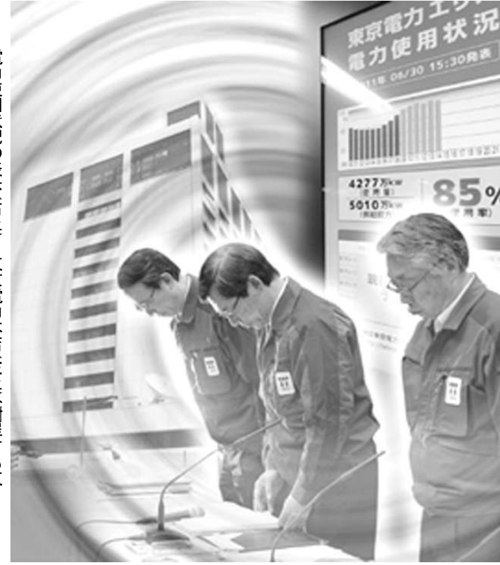
電力使用状況の表示(右)と東京電力本店(左)、謝罪する東電幹部(下)のシーン

「制作現場の人間とのロビーづくりを考える。特定のテレビ局をシンパにするだけでも大きい意味がある。『逆境の時こそマスコミにアプローチするチャンス』。科学技術庁(当時)の委託で財団が91年にまとめた報告書「原子力PA方策の考え方」は赤裸々にこう述べている。