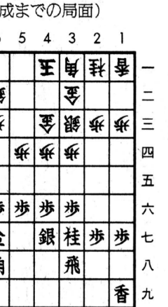
(○7七桂成までの局面)

「意見や感想を言ったことはあるが抗議はしてない」とする関西電力。関西電力側は「毎日放送の依頼を受けて」（関西電力、関西電力を講師に原子力安全に関する勉強会が開かれていた。意見広告