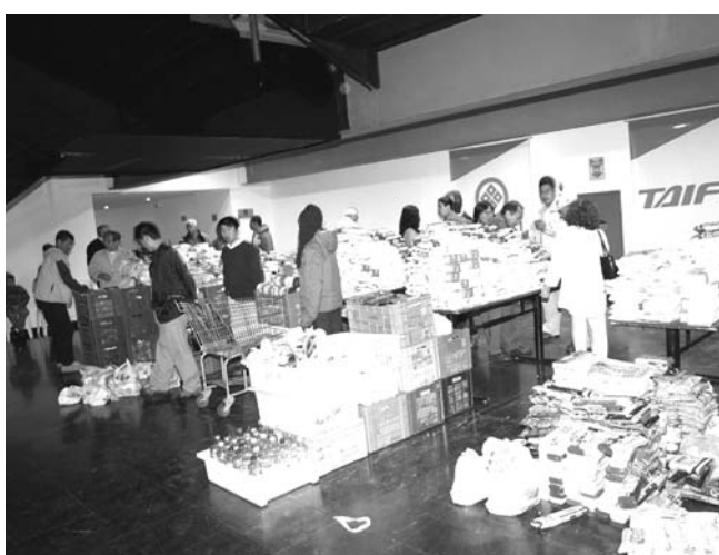
集められた保存食

「これは狩猟民族の思想じゃやっつけいけない。日本の精神文化を取り入れれば、ブラジルはよくなるはず」と信じて 盛和塾の合同定例会でビデオを仲間に見せた