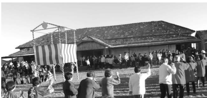
演芸発表後の盆踊りも大きな盛り上がりを見せた

アルバレス・マツシヤード文化体育農事協会(佐野アルベルト会長)主催の「第92回招魂祭」が8日、同地の日本人墓地及び旧プレジジョン植民地第一小学校で開催され、先亡者慰霊法要と慰霊祭が執り行われた。前日まで大雨が振ったが、今年も「招魂祭晴れ」に恵まれた。演芸発表などが行われた慰霊祭には約700人が詰め掛けた。それに先立ち行われた先亡者慰霊法要には約400人が出席、それぞれに先亡者の冥福を祈った。