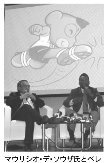
マウリシオ・デ・ソウザ氏とペレ

元サッカーブラジル代表のペレをもとにしたキャラクターが主人公の漫画『ペレジーニョ』。1982年以降の復活を記念した記者会見が先月27日、聖市パカエンブー競技場にあるサッカー博物館(Museu do Futebol)であった。作者のマウリシオ・デ・ソウザ氏も出席し、非公式ではありながらも『ペレジーニョ』で共に再来年に控えるブラジルW杯を盛り上げていくことを宣言した。 昨年10月に東日本大震災の被災地を訪問した。