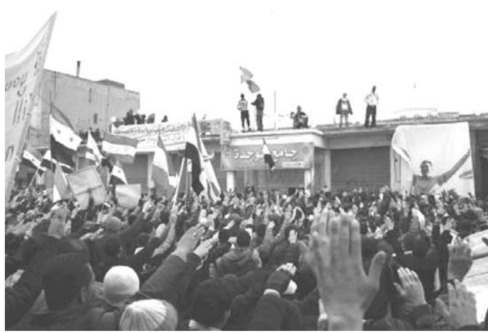
シリア北東部カミシュリで、金曜礼拝の後、アサド政権に抗議する人々(4月27日)(ロイター=共同)

▽危険と隣り合わせ 悩ましいのは、地方都市の多くで4月の「停戦」後も戦闘が止まらずに戦っていることだ。民間団体のジャーナリスト保護委員会(本部ニューヨーク)は昨年11月以来、シリアで取材記者ら少なくとも8人が死亡したと発表している。欧米メディア記者の中には、反体制派の手引きで隣国トルコから密入国を図り、政権側に身柄を拘束される人も。