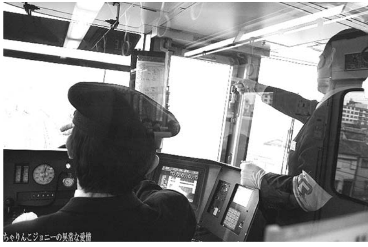
信号を確認しながら見習い運転士に、エコ運転教育をする先輩運転士

【共同】電力不足が懸念される夏本番を迎え、JR西日本の若手運転士有志が環境問題への取り組みとして研究を重ねたエコ運転が「節電の切り札」として期待されている。高度なテクニックを要するが、全員が実施すれば約2%の消費電力削減も可能だ。暑い夏を乗り切ろうと、それぞれが技の習得に励んでいる。