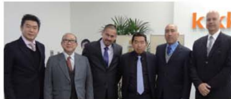
キッコーマン東京本社を表彰訪問した一行