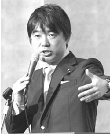
橋下徹氏を擁護する野田佳彦氏

【共同】衆院解散・総選挙が現実味を帯びる中、橋下徹大阪市長がどう出るか、世論調査でも橋下氏が率いる大阪維新の会の国政進出を期待すると答えた人は6割を超えた。43歳の政治家の動向から今後、目が離せなくなるのは間違いないが、世界を見渡せば40代の国の指導者は珍しくない。閉塞(へいそ)晋三氏が52歳で最も若く、54歳3カ月で就任した野田佳彦首相は田中角栄氏より1カ月だけ遅く3位。40代首相はまだ誕生していない。 欧米主要国では国政レベルで40代指導者がめり押し。英国のキャメロン首相は45歳、政権奪還を目指す野党・労働党首のミリアンド氏は42歳だ。ロシアはプーチン氏(59)が5月に