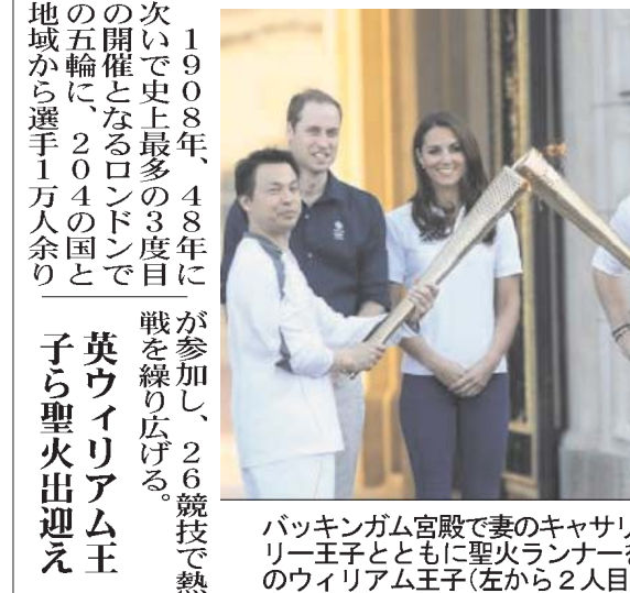
1908年、48年に次いで史上最多の3度目の開催となるロンドンでの五輪に、2014の国と地域から選手1万人余りが参加し、26競技で熱戦を繰り広げる。英ウイリアム王子ら聖火出迎え

【ロンドン共同】ロンドン五輪は27日午後9時(日本時間28日午前5時)、市東部の五輪スタジアムで行われる開会式でいよいよ幕を開ける。 日本選手団の調整は仕上げの段階に入り、クライマックスが近づき、聖火リレーは市民の歓声を浴びて市中心部を巡り、ハイドパークで約6万人に