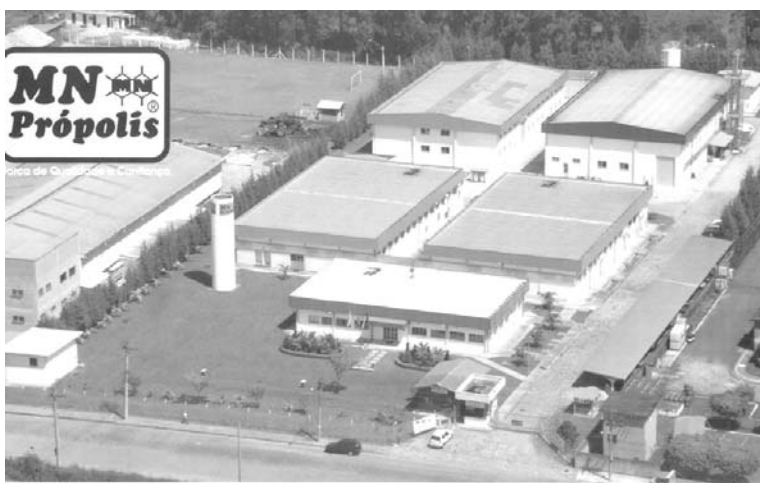
MNプロポリス本社工場

MNプロポリス社 (MN Propolis-Industria Comercio e Exportacao Ltda. 1992年8月創立)の経営哲学は「健康で明るく、隙間産業精神に徹し、オンライン企業をめざし、誰にも負けない努力をする。また、心を高め、利他の心で経営し、社会に貢献する」ことである。