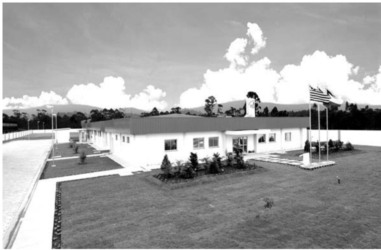
CETAL食品分析センター

MNプロポリス社 (MN Propolis-Industria Comercio e Exportacao Ltda. 1992年8月創立)の経営哲学は「健康で明るく、隙間産業精神に徹し、オンライン企業をめざし、誰にも負けない努力をする。また、心を高め、利他の心で経営し、社会に貢献する」ことである。