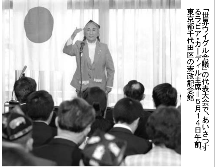
「世界ウイグル会議」の代表大会で、あいさつするラビア・カーディル主席(5月14日午前、東京都千代田区の憲政記念館)

※これを読めば自然に、日本の文化や歴史に関心をもてるような話を毎週掲載しています。より多くの二世の方々や日本語学習者に読んでもらい、少しでも日本に興味を持ってもらえるよう、最寄りの日本語学校や日系団体の掲示板に張ったり、普段は邦字紙を読んでいない兄弟や子や孫などに記事を紹介してください。(ニッケイ新聞編集部)