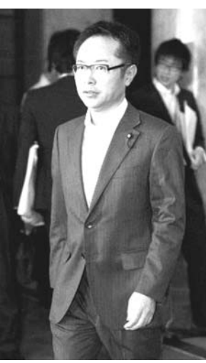
閣議に臨む古川経財相

【共同】古川元久経済財政担当相は7月27日の閣議に2012年度の年次経済財政報告(経済財政白書)を提出した。技術革新を促す可能性のある起業の活性化で経済再生を目指すべきだと提言。環太平洋連携協定(TPP)の交渉参加をにらみ、各国との自由貿易を推進する必要性も強調した。