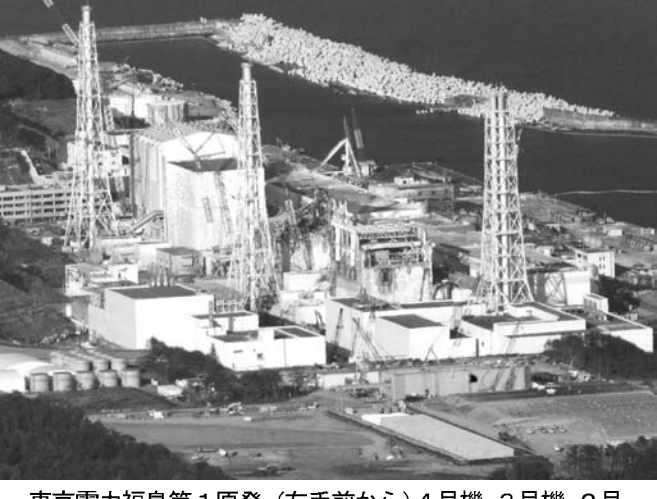
東京電力福島第1原発。(右手前から)4号機、3号機、2号機、1号機

【共同】検察当局は1日、東京電力福島第1原発事故に関し国や東電側に刑事責任があるとして、業務上過失致死傷容疑などで各地検に出訴された告訴・告発状を受理した。今後、最高検の指 また、福島地検は、福島県民ら約1300人が提出した東電幹部(当時)や原子力安全委員会幹部ら33人に対する告訴・告発を受理したほか、金沢地検も東電幹部(同)を対象とした告訴を受理した。 最高検幹部は「最初から立件を諦めるのではなく、しっかりと捜査して判