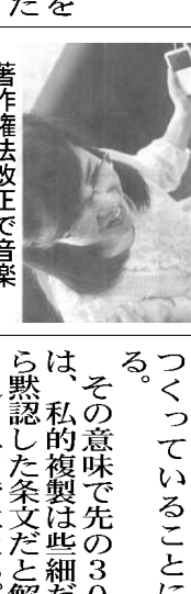
著作権法改正で音楽や映像の楽しみ方はどう変わるのか

「複製権侵害」。このように複製に制約をつけてゆく方法は、果たに2010年の改正で... 複製された1971年時点での複製品を複製する行為を指す。