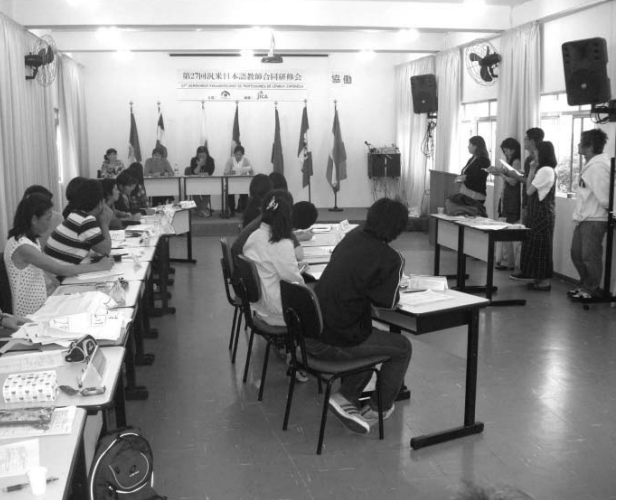
汎米研修ワークショップの様子

先日、健康体操を巡る2団体の対立を報道した。コラムの書き方一つで誤った印象を与えかねないため、慎重に問題の中心部分だけを書いた。