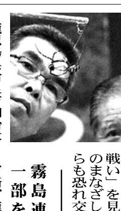
大館市の早小学校の恒例行事「徒渡」