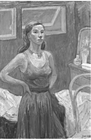
若い女性(自画像) トーヴェ・ヤンソン(1902、スオミ相互生命保険会社)

ヤンソンが描いたムーミン谷の住人たちの原画だ。テレビアニメのイメージと異なる、はがきのような小ぶりの紙に、インクの線で繊細かつ大胆に、光と影、木々や雪など森羅万象を紡ぎ出している。