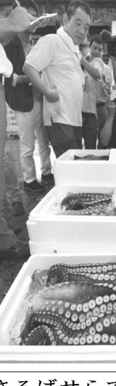
東京・築地市場に並んだ福島県沖で捕獲されたタコ。都内の仲卸業者が購入した2日未明

【ニューヨーク共同】米国内とカナダの旅客機で機内食のサンドイッチに針が混入しているのが相次いで見つかり、米連邦捜査局(FBI)などが各国内捜査当局が捜査していることが1日分かった。