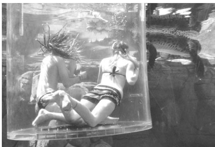
水槽で泳ぐワニを間近で見物する「死のおりん」に挑戦する観光客(7月、オーストラリア北部ダーウィン(共同))

【共同】人気映画「クロコダイル・ダンディ」の撮影地として知られるオーストラリアの北部特別地域(準州)。豊富な鉱物資源のほかに目立った産業がない中、巨大岩石ワニ(エアーズロック)と並び観光産業の目玉として、準州内に多く生息する凶暴なワニを前面に出したユニークな町おこしが進められている。