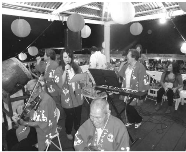
音楽部のみなさん

同大会は、文協が市から「地域を盛り上げる行事創設」との要請を受け、1961年に始まった。当初は文協が保有していた市内の野球場を会場としていたが、約20年前に売却し、現在の専用会場を創設。以来、売店や調理場の設置、客席のコンクリート化などの改修を行い設備の充実が図られてきた。午後8時頃、「花笠音頭」から大会はスタート。参加者は早速フロアに降りて列をなし、楽しげに体を揺らした。続いて8時半頃から行われた開会式では、木庭会長から盆踊りが郷土のために尽くした先駆者らの供養の意味を持つことが説明され、来場者に感謝の意が示された。