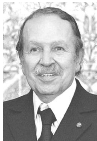
アブデルマジド・ブテフリカ氏

【共同】5月の国民議会選挙でイスラム政党が惨敗した北アフリカのアルジェリア。昨年からの中東民主化運動「アラブの春」を受けて、隣国チュニジアなどでイスラム政党が選挙で台頭した流れに乗ることを国民は拒否した。昨年続発した反政府デモも既に沈静化。安定を求めて、アルジェリアは世俗派であるブテフリカ長期政権を信任する「独自の道」を選んだ。