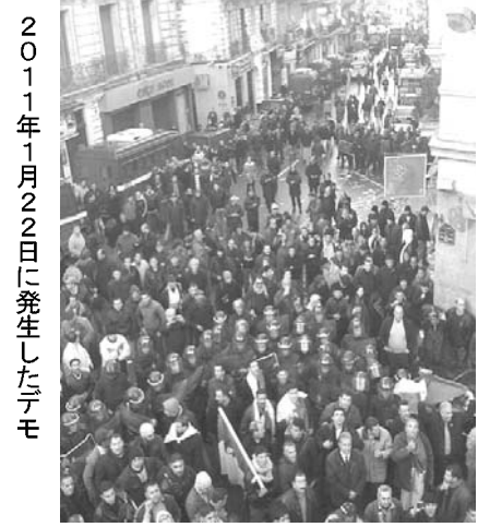
2011年1月22日に発生したデモ

の時代」の記憶は、国民の脳裏から消えていない。今回の選挙戦で、ウイヤヒア首相は、大統領選挙をめぐる再び治安が悪化しつつあるエジプトなど、サイード・カスミ講師は「悲劇を繰り返したくない」との国民の思いは強い」と解説する。アルジェリアでは昨年1月以降、食料価格高騰や深刻な失業率への不満