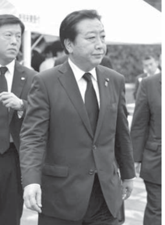
野田首相と谷垣総裁の会談の様子。野田首相は左、谷垣総裁は右。

【共同】衆院解散の時期を「近いうち」とした野田佳彦首相と谷垣禎一自民党総裁の合意の解をめぐり、民主、自民両党の攻防が激しくなった。今国会中を主張する自民党に対し、与野は大規模な解散先送りを狙う。今秋の可能性が出てきたとの見方も根強い。首相と谷垣氏が2人だけで会談した「密室の30分」に何が話し合われたのか。永田町で臆測が乱れ飛ぶ。9日午前の自民党役員会で、参院幹部は「社会保障と税の一体改革法案が成立すれば徹底抗戦だ。あらゆる手段を用いて近いうちの解散を表現させたい」と意気込んだ。これに対し、与野幹部は会合で「首相は谷垣氏に解散を確約したわけではなく、民主党の勝ち」と宣言した。