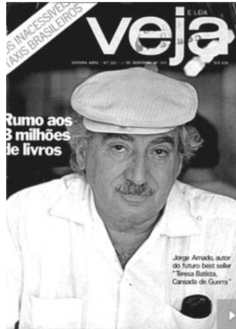
ジョルジ・アマードを特集した1972年のVeja誌

1912年8月10日生まれ、国民作家ジョルジ・アマードがその生涯を閉じたのは、2001年8月6日であった。享年88歳だった。それから11年経った今年、生誕百周年の年なので、この「ブラジルの国民的遺産」(評論家パウロ・フランシスの表現)を讃える関連イベントが行われている。