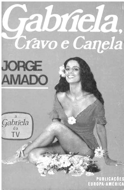
代表作の一つ『ガブリエラ、丁子と肉桂』の表紙

「ブラジルもハイチも全くふれられていない、まさしく植民地主義的な見方だ。と、彼自身はキューバのニコラス・ギリエン(詩人)やチリのパブロ・ネルウダ(詩人)あるいはパブロ・ピカソとも親交があったので、特にスペイン語圏に反発があるわけではない。アマードとしては、黒人要素の強い、多様な文化を包摂するブラジルを、ラテンアメリカの一言に含めるな、ということだろう。あるいは、彼の小説が、前期の政治色が強い文学と後期のトピカルな快楽肯定主義的傾向に分かれているとの指摘に対し、「私の作品群は、処女作から最新作まで繋がっており、一つの統一体なのだ」と強調している。