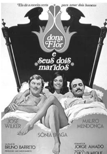
アマード作品を主体にした映画