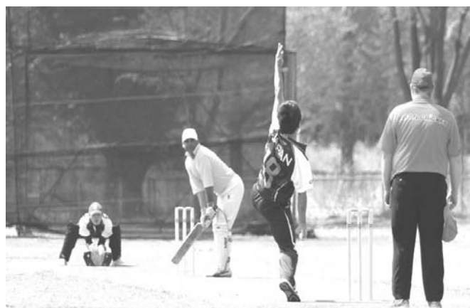
クリケットの試合風景

【共同】ロンドン五輪を機会に、どっぴり英国文化に漬かってみるのも悪くない。スポーツ、音楽、マナー…。現地に行かなくても、日本でも体験できる。さあ、〈英国人〉になり切ってみよう！