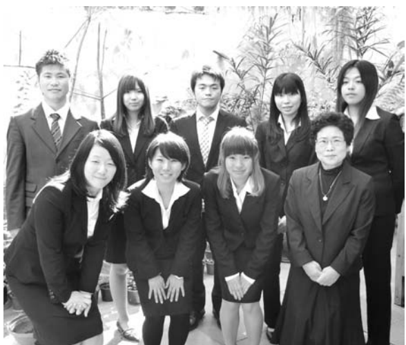
来伯した研修生ら

ブラジルの福祉事情や生活文化を学ぶため、ブラジルの福祉事情や生活文化を学ぶため、