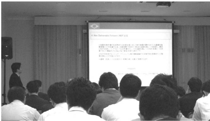
関心を呼んだ講演の様子