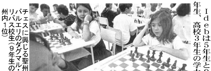
チエスに興じる聖州パルエリのダグマル、バルエリ生9年生の州内1位

高校過程では伸び悩み 政府カリキュラム見直し 教育省が14日、11年の基礎教育開発指数(Ideb)は、小学過程が0.9年より0.4高々期待以上の5、中学過程も0.3高い4.7だったが、高校過程は期待以下の0.2高い4.1で終り、カリキュラムの見直し検討を公表と15日付伯字紙が報じた。