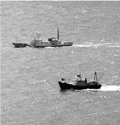
尖閣諸島（中国名・釣魚島）への上陸を目指していた香港の団体「保釣行動委員会」の抗議船が15日午後、魚釣島に到着し、メンバー7人が上陸した。沖繩県警と第11管区海上保安本部は、入管難民法違反容疑で、この7人を含むメンバー14人を現行犯逮捕した。

【共同】沖繩県・尖閣諸島（中国名・釣魚島）への上陸を目指していた香港の団体「保釣行動委員会」の抗議船が15日午後、魚釣島に到着し、メンバー7人が上陸した。沖繩県警と第11管区海上保安本部は、入管難民法違反容疑で、この7人を含むメンバー14人を現行犯逮捕した。尖閣諸島への外国人活動家の上陸をめぐる逮捕者が出たのは、2004年3月に中国人7人が上陸して以来、8年ぶり。野田佳彦首相は「法令にのっとる厳正に対処していく」と官邸で記者団の質問に答えた。外務省の佐々江賢一郎事務次官は15日夜、程永華駐日中国大使を外務省に呼び抗議した。