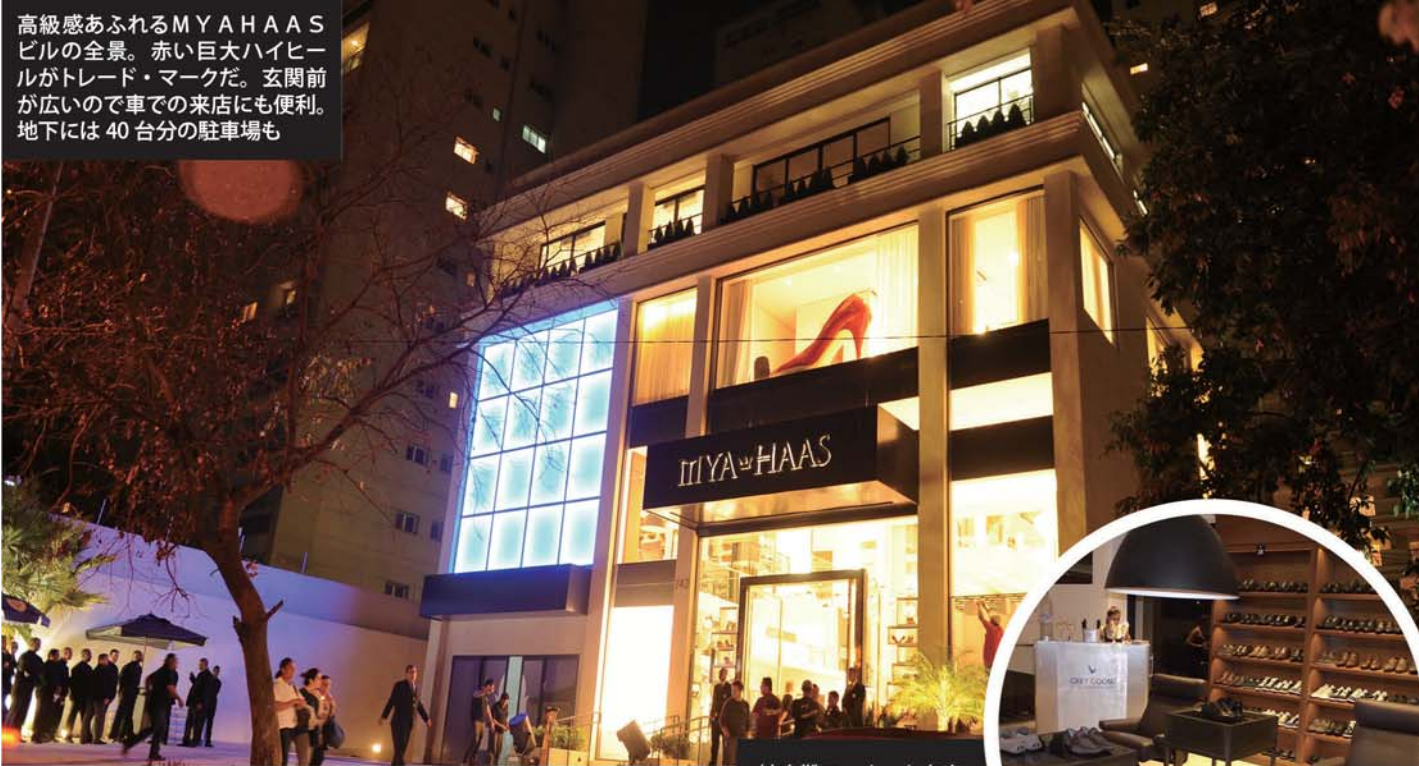
紳士靴コーナーも充実

高級感あふれるMYA HAASビル全景。赤い巨大ハイヒールがトレード・マークだ。玄関前が広いので車で来店にも便利。地下には40台分の駐車場も