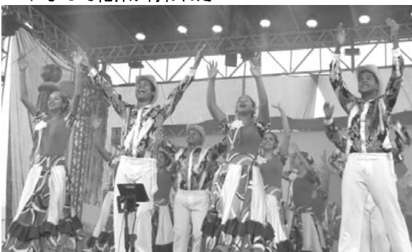
ブラジル中西部の伝統的な踊り「クルレ」と「シリリ」のグループ発表の様子

ト・グロツソ州の公式行事として登録されたほか、州政府からの助成金は10万レアルから23万に。各県とも地域を代表する日系イベントに成長した。