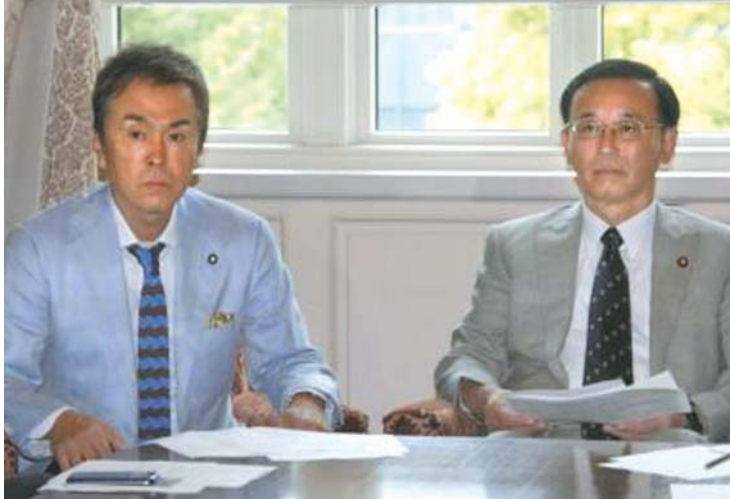
自民党役員会に臨む谷垣総裁(右)と石原幹幹事長=4日午前、国会

【共同】自民党の石原幹幹事長(55)は総裁選への対応に、8日の国会会期末前後に出馬へ向け最終判断する意向を固めた。再選を目指す谷垣禎一総裁(67)の去就を見極める。石原氏に近い議員が4日、明らかにした。出馬の意向を固めている石原氏(55)は、町村信孝元外相(67)、安倍晋三元首相(57)の陣営は支持拡大に向け動きを本格化させた。知名度の高い石原氏が出馬に踏み切れば、有力候補になるのは確実。谷垣氏が出馬する場合でも立候補に踏み切るかが焦点だ。石原氏は4日の記者会見で「幹事長の任にある間はしっかりと述べたい」と述べることとされた。