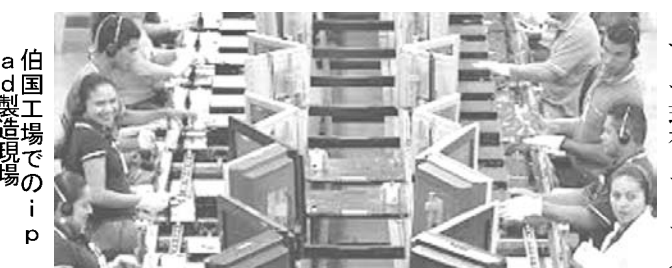
伯国工場でのiPad製造現場

工場は聖州ジュンジアイ 5カ月前から国内で製造 ジウマ大統領の昨年4月の訪中で最も注目された話題の1つが、実業家で鴻海精密工業社長の郭台銘氏との協議や富士康国際絡みのニュースで広く知られることになった。アップルのiPhoneとiPadの国内生産への移行だった。その後、工場の建設も含めて様々な投機的な話題で盛り上がった。 そして現在、アップルがブラジル国内で生産した製品は、ひっそりと「ブラジル製」のラベルが貼られ、ほとんど知られることもなく市場で流通している。ただし、販売されている製品は、フォックスコンがサンパウロ州の地方都市ジュンジアイ市に立ち上げた工場で製造された製品に、すべて置き換わったわけではない。大きな話題を集めて生産が待ち望まれていた製品は、5カ月前から、アナウンスもなく同工場においてフル稼働で製造されている。アジア以外でアップルが初めて生産する工場とあって、生産開始は、ジ