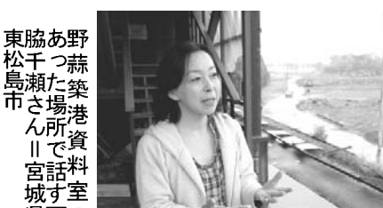
野蒜築港資料室の場所を説明する野蒜市長

潮風が香る海沿いの平地に、一本の松がぽつんと立っていた。二股の幹が一本の根元から引きちぎられた姿は、今も津波の威力を雄弁に物語る。宮城県東松島市の野蒜地区。松の傍らに立つた小さな石碑には「野蒜築港跡」の文字が刻まれていて、東日本大震災で甚大な被害を受けたこの地で、明治初期に「日本初」の近代港湾が建設された計画があったことは、あまり知られていない。当時の地域紙が「本地方の開闢以来、未曾有の一大事業」と記した野蒜