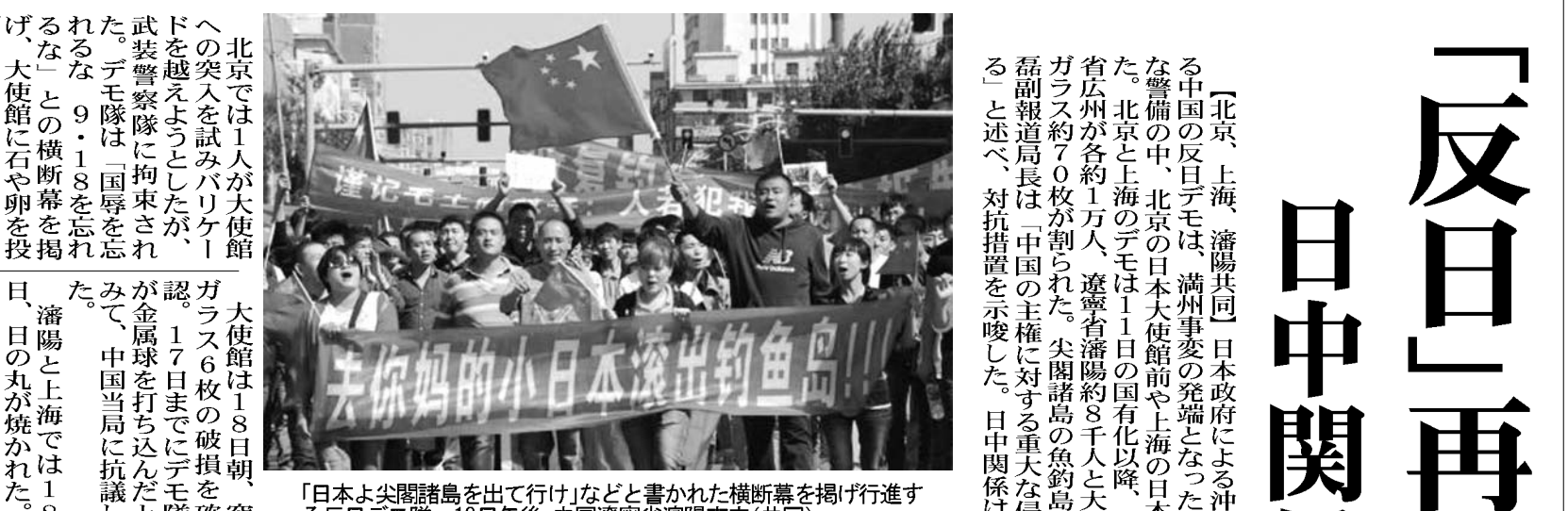
「日本よ尖閣諸島を出て行け」などと書かれた横断幕を掲げ行進する反日デモ隊=18日午後、中国遼寧省瀋陽市内

【北京、上海、瀋陽共同】日本政府による沖繩県・尖閣諸島(中国名、釣魚島)国有化に抗議する中国の反日デモは、瀋陽市での発端となった1931年の柳条湖事件から81年の18日、厳重な警備の中、北京の日本大使館前や上海の日本総領事館近くなど、少なくとも125都市で行われた。北京と上海のデモは11日の国有化以降、8日連続。参加者は上海約1万7千人、北京と広東省広州が各約1万人、遼寧省瀋陽約8千人と大規模化。投石などもあり、瀋陽の日本総領事館の窓ガラス約70枚が割られた。尖閣諸島の釣魚島に邦人男性2人が18日に上陸し、中国外務省の洪磊副報道局長は「中国の主権に対する重大な侵犯」と非難。さらなる対応を取る権利を留保する」と述べ、対抗措置を示唆した。日中関係は緊迫の度を深めた。