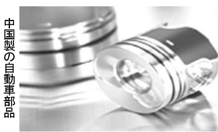
中国製の自動車部品

品質を犠牲にした低価格 タイヤ業界は締め出し要請 価格競争力に加えて世界最大の国内自動車市場に対する十分な供給能力を備え、しかも国外に対して製品を輸出する中国の自動車部品工業は、現在、ブラジル国内市場の自動車部品サプライヤーとして4位のシェアを持つ。 韓国やタイヤからも急増中 2012年は自動車産業における伝統的なパートナーであるアルゼンチンを追いついたが、アルゼンチンのクリスチーナ政権がブラジル製品への輸入障壁緩和に向けた対応の一環として、ブラジ