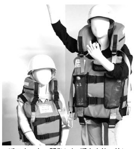
浜口ウレタンが開発した、浮力を約4倍に高めた救命胴衣

【共同】流水が生まれる瞬間を見られます。北海道紋別市の道立オホーツク科学館で、流水の発生過程を観察できる装置を開発した。水槽の中にできた小さな小さな水の結晶が、集まり成長していく。水槽は縦20センチ、横30センチ、奥行き1・5センチの亚克力製。その手段として電動バスをつかった。市街地の活性化にもつなげたという。