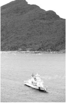
尖閣諸島の領海に中国の監視船が侵入した。海保が警戒を強化している。

【共同】18日午前6時50分ごろ、沖縄県・尖閣諸島の領海に中国の監視船が侵入した。海保が警戒を強化している。中国の監視船は、尖閣諸島の領海に侵入し、海上保安庁の巡視船が確認した。政府は首相官邸の危機管理センターに情報連絡室を設置し、中国からの漁船千隻が尖閣周辺に近づいているとの報道が、海上保安庁は警戒を強化している。