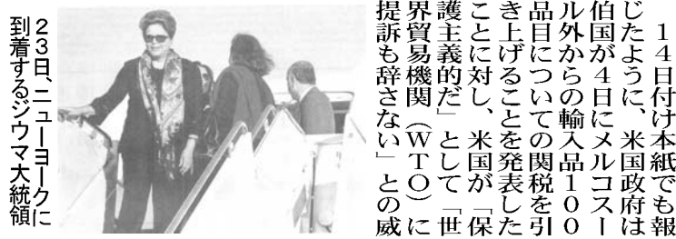
23日ニューヨークに到着するジウマ大統領