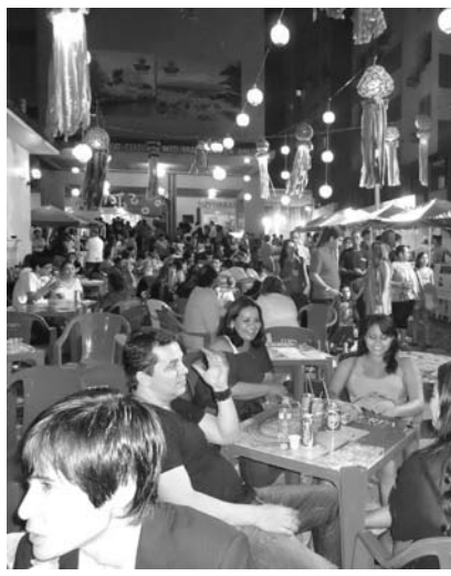
多くの参加者で賑わう郷土コーナー

「パラ州ベレン発」字・生け花・琴・折り紙・日本舞踊等のミニ講座とワークショップが開かれたほか、ベレン総領事館提供による日本映画「がんばってフラガール」の上映会もあつた。 また、認知度の低い同