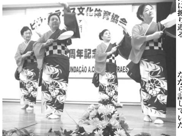
演芸会も大きな盛り上がりを見せた

（金婚式）。戦後の混乱を乗り越え、立派な会館を築き、文協の礎となつた7人の侍に心から感謝したい」と話した。