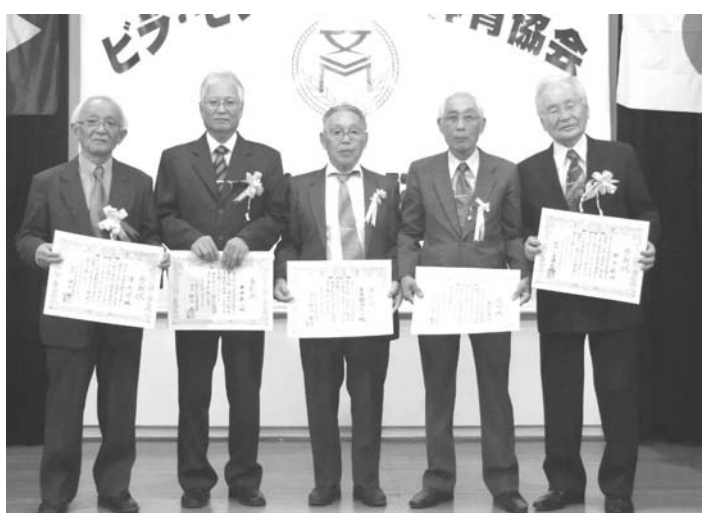
表彰された5人の歴代会長ら