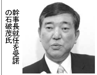
幹事長就任を受諾 の石破茂氏