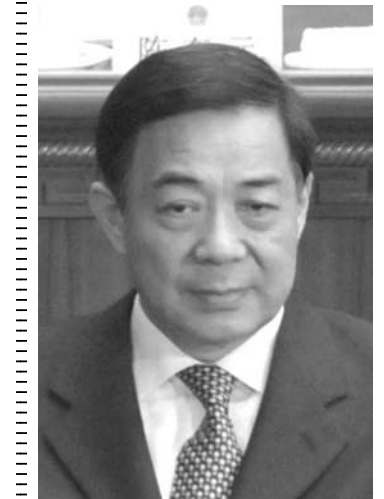
薄氏、懲役の可能性もある

【ニューヨーク共同】野田佳彦首相は26日午後（日本時間27日未明）、米ニューヨークで記者会見し、中国が領有権を主張する沖繩県・尖閣諸島について譲歩しない意向を強調した。「わが国固有の領土であることは明白だが、領有権問題は存在しないというのが基本で、後退する妥協はあり得ない」とけん制した。島根県・竹島をめぐる韓国との対立にも触れ「これらの諸問題が2国間関係を損なうことがないよう、互いに大局観を見失わず意思疎通を図るのが大事だ」と強調。「東アジアの安定と平和に悪影響が出ないように」と、冷静な対応を呼び掛けた。