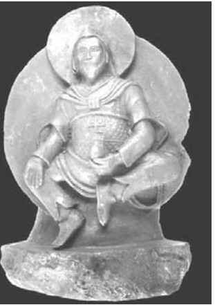
ワシントン共同。930年代末にナチスがチベットから持ち帰った彫像を調べてみると、宇宙から落下した珍しい隕石でできていることがわかった。

【ワシントン共同】930年代末にナチスがドイツがチベットから持ち帰った彫像を調べてみると、宇宙から落下した珍しい隕石でできていることがわかった。考古学者とナチスが登場する映画「イン・ザ・ベレーツェ」の撮影現場で発見された彫像の成分を調べたところ、隕石の成分と一致していることがわかった。