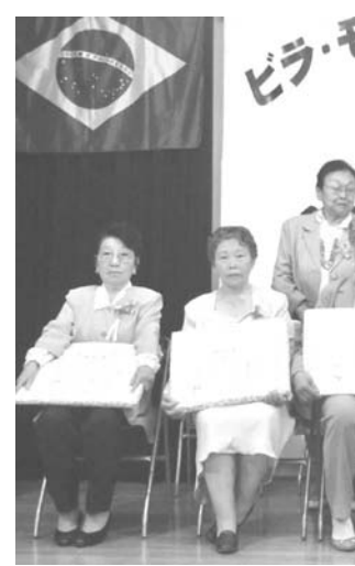
歴代婦人部長の皆さん

年を迎えることが出来た。夫婦の結婚に譬えれば、オウロ（金婚式）にあたり、本当にめでたきことである。