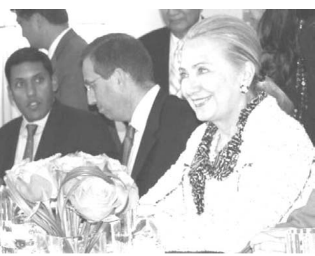
クリントン米務長官とテイン・セイン大統領の会談に臨むクリントン米務長官(右)=26日、ニューヨーク

【ニューヨーク共同】クリントン米務長官は26日、国連総会出席のため訪米したミャンマーのテイン・セイン大統領とニューヨーク市内で会談し、対ミャンマー制裁の一環として科している同国製品の輸入禁止措置について「緩和への手続きを始める」と伝えた。米政府高官によると、制裁のほぼ全面的な解除につながる可能性がある。手続きを始める対象はブッシュ前政権時代の2003年に成立したミャンマー制裁法など。