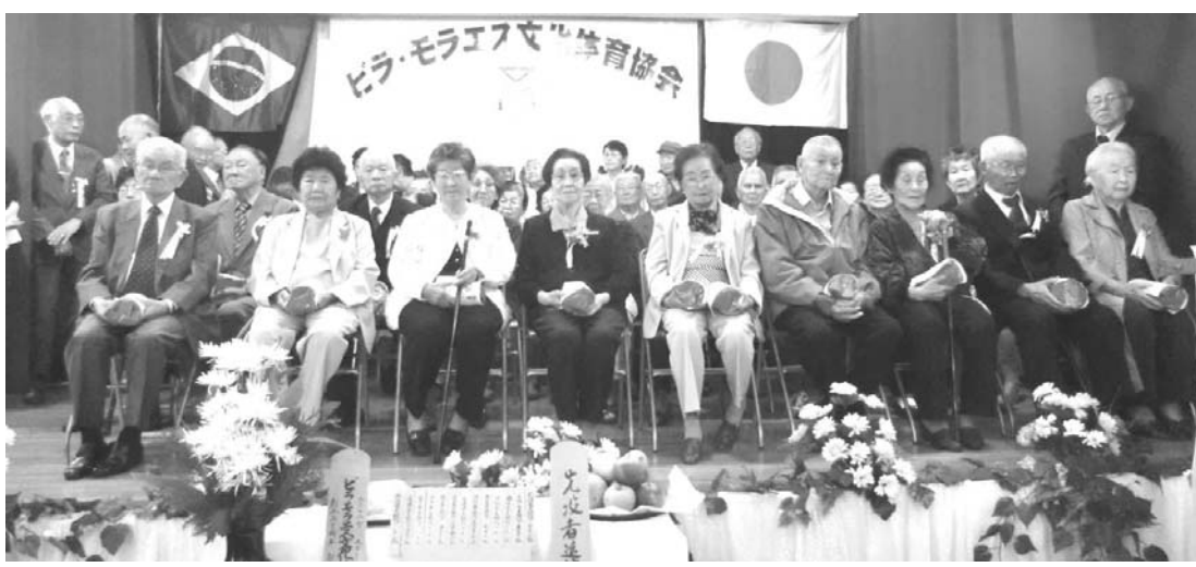
高齢者表彰には多くの方々が出席した

同文協は1962年にあった日本語学校「双ジャルジン・サウデーラ 葉学園」の分校を開校す