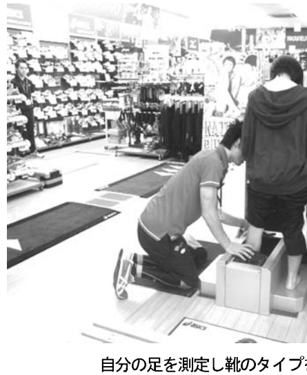
自分の足を測定し靴のタイプを選ぶ

【共同】広島県大崎上島町で、柿の出荷が本格化している。滑らかな舌触りと高い糖度が特長で、贈答品として人気が高いという。作業は今月中旬まで続く。JA広島ゆたか上島選果場(中野)で、職員が直径約10センチ、重さ約300グラムの果実を選別、化粧箱に詰めている。広島市中央卸売市場(西区)に送る。今年はいまだ台風の影響も少ないなど天候に恵まれたため、同JAは昨年の1.5倍の6トンの収穫を見込んでいる。