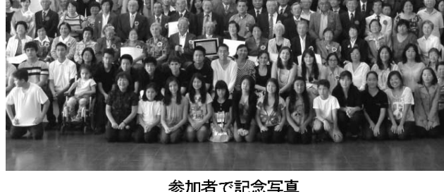
参加者で記念写真

最後に記念プレートの除幕が行われ、参加者は昼食を食べながら楽しく歓談。午後の演芸会を