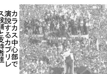
カラカス中心部で演説するカプリレス候補と支持者達

今年9月29日、フェルナンド・コロロ氏が伯国史上初の大統領の判決を受けて、コロロ大統領弾劾決定の最終段階に入った。 日付付字紙がそれぞれの視点から、この裁判を振り返っている。 エスタード紙は、コロロ大統領弾劾決定の最終段階に入った。