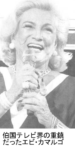
伯国テレビ界の重鎮だったエビ

「遺産を残した」(ジョゼ・セーラ市長候補) 「人生を思いのままに生きた勝者を私は忘れてきた」(マルタ元聖市市長) 「勇気の象徴であり、ジャナリスムの良心」(マルドナルド元聖市市長) 「エビ」が伯国のテレビ史だ。(ジウマ大統領) 「最初にメデアンの女王」(シウシャ/司会者) 「あの大らかな笑い声が近