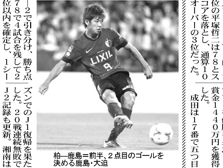
鹿島が清水を相手に2-0で勝利し、決勝に進出する

【共同】Jリーグ・ヤマザキナビスコカップ準決勝第2戦が13日、アウトルックスタジアムで行われ、鹿島が清水を相手に2-0で勝利した。