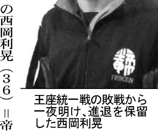
統一戦の敗戦から一夜明け、西岡利晃