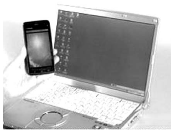
液晶画面から出る「ブルーライト」への関心が高まっている。スマートフォン、タブレット端末、パソコンなど、長時間見続ける人が増えている。

【共同】パソコンやスマートフォン（多機能携帯電話）などの液晶画面を長く見続けるような生活スタイルの広がりとともに、画面から出る青色の光「ブルーライト」の人体への影響に関心が高まっている。大量に浴びれば目に有害とされる一方、睡眠・覚醒リズムの調節に重要な役割を担うことも分かっていた。医師らが研究会を足踏させ、ブルーライトと賢くつきあおう方策を探る動きが活発化している。 △LEDに注目 太陽の光は白っぽく見えるが、プリズムで分けると赤、黄など波長の異なるさまざまな色の光が含まれている。このうち青く見える光がブルーライトだ。波長は約400〜500ナノメートル