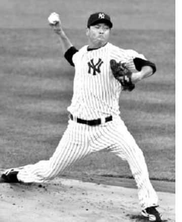
7回2死、黒田が先発投手として力投する

【ニューヨーク共同】ヤンキースの黒田は粘りが報われず、敗戦投手となった。八回2死までを5安打3失点で11奪三振、初戦を落とし、主将ジョー・ペーが離脱した窮地に先発でメジャー初の0-1の八回に2死一、二塁とされて降板。後続が打たれた。37歳の黒田は地区