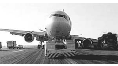
ヴァイロコッポス空港の滑走路に止まったままのMD11号

0年計画で国道と鉄道の建設プランを発表したのも改善策の一つだった。それに加え、伯国では14年にサッパのワイルド・カッパ、16年にリオ五輪という国際的な大イベントを控えており、観光客の輸送手段の確保は必須の問題。W杯開催都市のインフラ整備は大幅に遅れており、空港の拡張もままならないまま、2大イベントを受け入れざるを得なくなっている。 そんな矢先に今回の騒動は起きた。13日午後8時頃、ヴァイロコッポス空港の滑走路で米国のマイアミからの貨物便MD11-1号のタイヤがパンクし、その場から動かなくなりました。 同空港は滑走路がひと