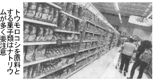
トウモロコシを原料とする菓子類はナトリウムが多く要注意

高血圧や糖尿病といった成人病の発生は食事によるものが大きい。Anvisaが調べた26種類の食品中21種類は高血圧などの原因となるナトリウム(ソディウム)が多く、食の見直しが必要とされている。加工食品より自然の物を、必要な状態である事が判明した。