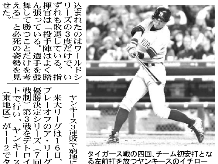
イチローの奮闘実らず ヤンキース3連敗で窮地に

【共同】プロ野球のCSファイナルシリーズ2012の出場権を争うクライマックスシリーズ(CS)ファイナルステージ(6試合制)は17日、第1戦が行われ、札幌ドームでのパ・リーグは日本ハムがソフトバンクに3-2と逆転して先勝した。リーグ優勝チームには1勝のアドバンテージがあるため、2勝差とした。東京ドームでのセ・リーグは2位から勝ち上がった中日が1勝を挙げ、巨人に3-1で競り勝った。 日本ハムは2点を先制された直後の七回に糸井の2ランで同点とし、代打二岡の右前打で勝ち越した。