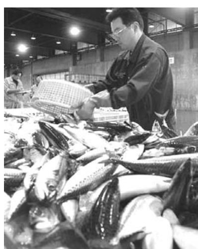
釧路で水揚げされたサバ

【共同】北海道東部の釧路沖でサバが異例の豊漁となっている。近年ほとんど取れなかったが、8月中旬から約9千トンの水揚げがあった。例年になく猛暑で海水温が過去最高を記録したことが原因とみられる。暖かい海域を回避するマンボウやカジキが定置網にかかり、シシヤモが不漁となるなど珍現象も相次いでいる。