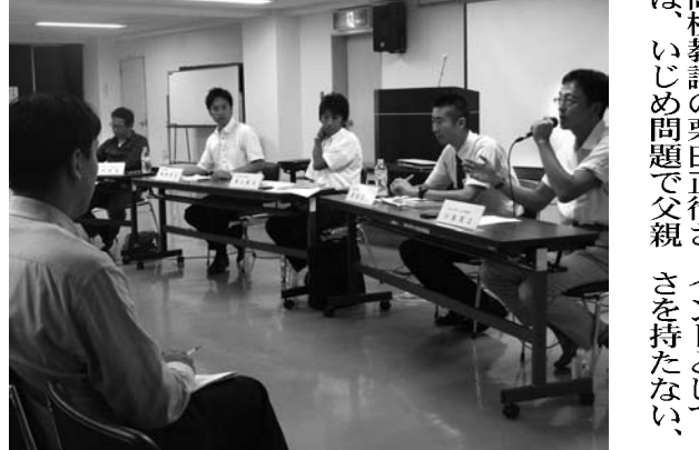
ファザリング・ジャパンが開いたフォーラムで「いじめ問題」を議論する父親たち=東京都文京区