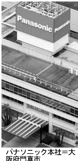
大阪府門真市のパナソニック本社。

【共同】電機大手8社の2013年3月期連結決算の業績予想は、海外勢との競争に敗れ、テレビ（赤字）の合計は、1兆2千億円を超えた。日中関係の悪化や長引く円高の影響で他の6社も業績は振るわず、NECを除く7社が売上高の見直しを下方修正した。サムスン電子やLG電子など韓国勢は低価格を武器に世界市場で攻勢を強めており、国内各社の劣勢が鮮明になっている。日本の製造業を支えてきた電機メーカーは瀬戸際に追い込まれた。