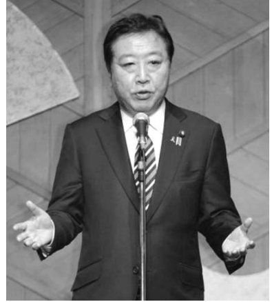
野田佳彦首相は1日午後、東京都内のホテルで記者会見し、公債法案の審議入りについて述べた。

【共同】臨時国会の焦点となっている公債発行特例法案は1日、衆院財務金融委員会が来週にも審議入りする方向となった。自民党が年内の衆院解散・総選挙を求めたため譲歩し、公明党も同調した。ただ自公両党は2012年度予算の減額補正を求めており、公債法案の成立までにはなお曲折がありそうだ。民主、自民、公明の3党は1日、衆院予算委員会を国会会中2日間開催することでも合意した。自民党の安倍晋三総裁は記者会見で「野党が予算案開議に促したため、公債法案の審議に促していく」と述べた。自民党は、野田佳彦首相が衆院解散に向けた環境整備の「3条件」として示す公債法案の処理を進め、首相に決断を迫る構え。