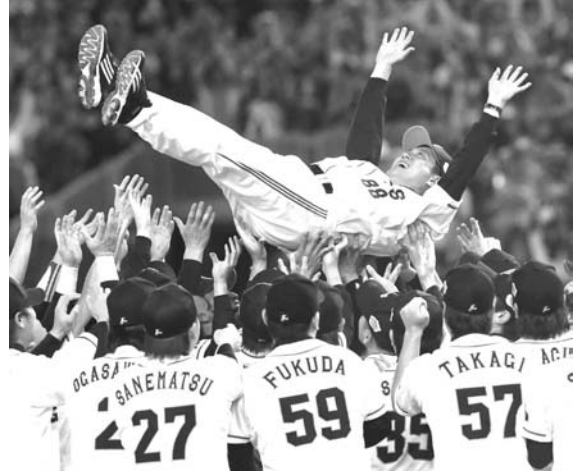
プロ野球の日本シリーズを制して3年ぶりの日本一となり、ナインに胴上げされる巨人・原監督