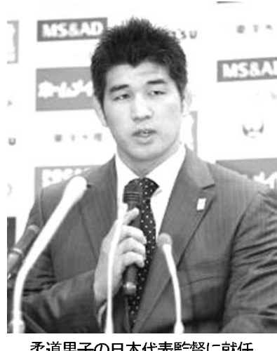
柔道男子の日本代表監督に就任し記者会見する井上康生氏

【共同】全日本柔道連盟(全柔連)は5日、ロンドン五輪で史上初の男子メダルを挙げた金子直也(20)の日本代表監督に2000年シドニー五輪100キロ級金メダリストの井上康生氏(34)が就任したと発表した。東京都文京区の講道館で記者会見した井上監督は「柔道界の再建に向け、全身全霊をかけていく」と決意を述べた。女子の新体制がスタートする。井上康生、日本男子監督