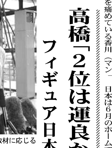
中国から帰国し取材に応じる高橋大輔

ファイギュアスケーターのグランプリ(GP)シリーズ第3戦、中国から帰国し取材に応じる高橋大輔