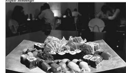
Prato com sushi e sashimi, em São Paulo: maior oferta e preços mais em conta

Gastronomia Ao gosto brasileiro Comida japonesa se torna popular como o churrasco nas principais capitais do Brasil Rosana Zakabi