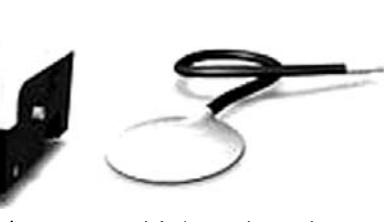
MRIエラストグラフィーで使われる、空気の振動を発生させる装置(左)と患者に取り付ける円盤状の器具

「共同」慢性肝炎は、肝臓の細胞が長期の炎症で壊れていく病状だ。放置すれば肝臓の組織が硬くなる「線維化」が進み、肝硬変や肝がんへと悪化していく。病状の把握や治療効果の判定には