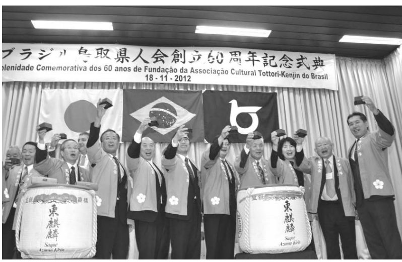
来賓一同で行われた鏡割り