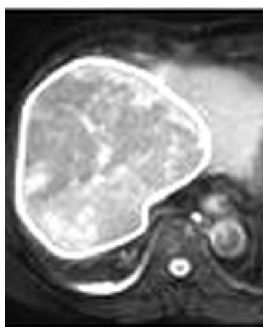
80代男性の巨大肝細胞がん。通常のMRIによるモノクロ画像(左)と硬さを色分け表示したMRIによる画像(右)。白い線で囲んだ部分ががん

線維化の程度を調べる検査が欠かせない。現在、その中心は針を刺して組織を採取する肝生検だが、患者の体の負担が大きいなどの問題があった。今夏、従来の磁気共鳴画像装置(MRI)と組み合わせて肝臓の硬さを画像化し、体に負担をかけずに病気の進行度を診断できる国内初の技術が登場した。