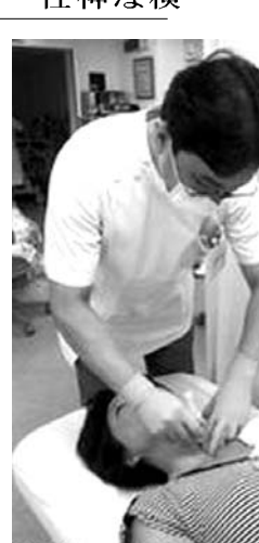
頸椎性神経根症に対する神経ブロックの様子

画像装置(MRI)で検査する。椎間板ではなく、骨自体が飛び出している「頸椎性神経根症」と分かった。手術で根治させる方法もあつたが、症状が進むものではないと、痛みが軽減する。MRIで検査する。椎間板ではなく、骨自体が飛び出している「頸椎性神経根症」と分かった。手術で根治させる方法もあつたが、症状が進むものではないと、痛みが軽減する。