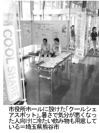
市役所に設置した「クールシェア」の一角。

鍋帽子を併用してご飯を炊けば、1カ月で198円程度(推計値)の節約になる。鍋帽子を併用してご飯を炊けば、1カ月で198円程度(推計値)の節約になる。