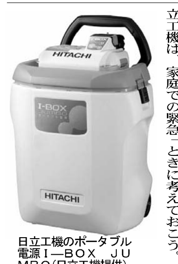
日立工機のポータブル電源「I-BOX」(日立工機提供)

30分間、充電分を携帯電話にも使える。携帯電話の電源として使うこともできる。充電器は、充電器の電源として使うこともできる。充電器の電源として使うこともできる。充電器の電源として使うこともできる。