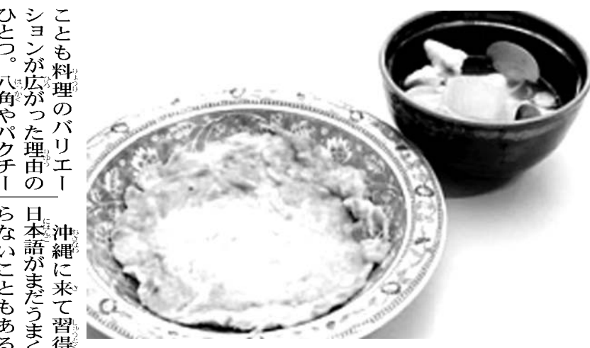
切り干し大根の食感が特徴の菜脯蛋(左)と、鶏とはまぐりのだしを生かした蛤蜊冬瓜湯

【材料2人分】 イカ 1匹 オクラ 7本 納豆 1パック ヤマモモ 200g マヨネーズ 大さじ1 めんつゆ 大さじ2 作り方 (1) イカは内臓をとって中をよく洗い皮をむく。イカ刺しの要領で半分にしてから細切りにする。ミミヤ ゲソも好みで使用する。器にヤマモモを混ぜ、上にイカ、オクラ、納豆を盛りつける。調理のコツ イカは新鮮なうちに、皮をむくときれいに。クッキングペーパーを使用すると滑りにくい。皮をむいたら洗わないほうが鮮度が落ちない。めんつゆは希釈しないで使用する。 講師 北海道調理師学校・藤田真由美