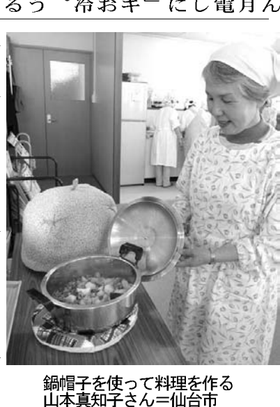
鍋帽子を使って料理を作る。

人もいるでしょう。でも、緊急時はコンビニも閉まっているかもしれない。エンジンで回さないで充電できるのが、車に搭載されている。