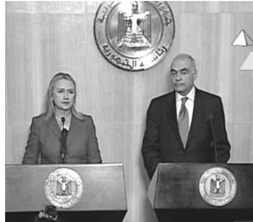
21日、エジプトのカイロで、米長官ヒラリークリントン(左)とエジプト外相アムル・ムバラク(右)が共同記者会見を行った。

【カイロ、エルサレム共同】イスラエルとパレスチナのイスラム原理主義組織ハマスとの停戦を仲介していたエジプトのアムル外相は21日、双方が同日午後9時(日本時間22日午前4時)からの停戦に合意したと発表した。クリントン米国防長官とカイロで共同記者会見し、明らかにした。14日に始まった戦闘は8日目で東東に向かう見通しとなった。イスラエル軍によるパレスチナ自治区ガザへの地上侵襲という最悪の事態は回避された。ただ停戦後もガザからイスラエルへは少なくとも20発のロケット弾が飛来。過去の停戦も多くが破られており、武力衝突再燃の恐れはなお残っている。