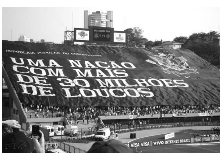
日本でも本場同様の熱い応援を繰り広げるかも?! (ウィキペディアより)

リベルタドーレス杯優勝を決めた直後、同クラブ役員は「1万人の応援団を日本に送る」と宣言してサッカー関係者を驚かせたが、まんざら大口ともいえない雲行きとなってきた。