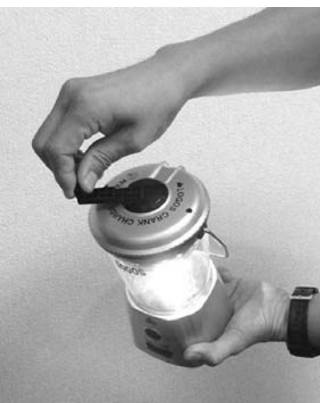
手回し発電で光るLEDランタン。

30分間、充電分を携帯電話にも使える。携帯電話の電源として使うこともできる。充電器は、充電器の電源として使うこともできる。充電器の電源として使うこともできる。充電器の電源として使うこともできる。