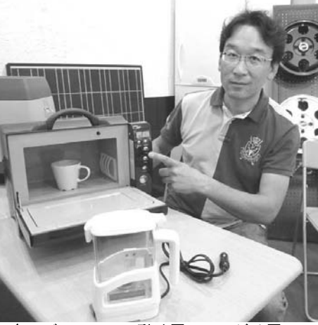
車のバッテリーで動く電子レンジや携帯電話の充電に役立つ。太陽光充電器は、災害時にも有効。

【共同】東日本大震災から2年目。電力供給が逼迫した際の計画停電や、災害による場合など、心配なのが停電だ。いざというとき、どう電源を確保するか、できることを考えてみよう。