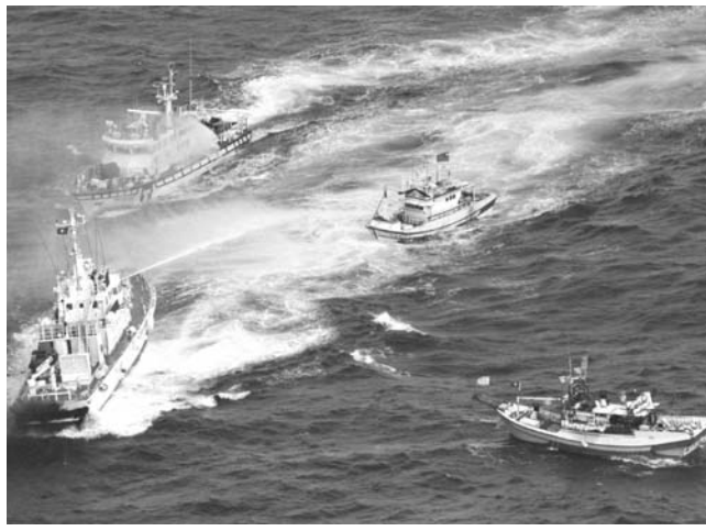
沖縄県・尖閣諸島周辺の日本の領海に侵入した台湾漁船に放水する海上保安庁の巡視船(左下)。左上は台湾の巡視船