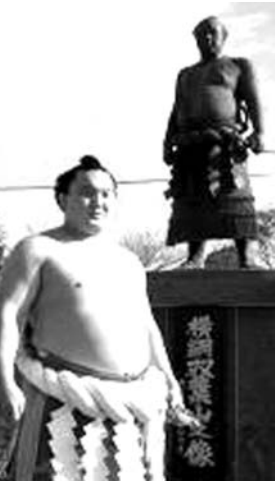
双葉山の像の前で、ポーズをとる横綱白鵬

【共同】3年ぶりの開催となった大相撲の冬巡業が4日、不世出の大横綱双葉山の生誕100年を記念し、出身地の大分県宇佐市で開かれ、双葉山を尊敬する横綱白鵬らが参加した。 会場の体育館には平日にもかかわらず、満員の観客が詰め掛け、2500人が詰め掛けた。同市では20年ぶりの巡業だったが、あらためて「昭和の角聖」の存在が示された。 2010年に不滅といわれる双葉山の69連勝に挑み、史上2位の63連勝で止まった白鵬。朝