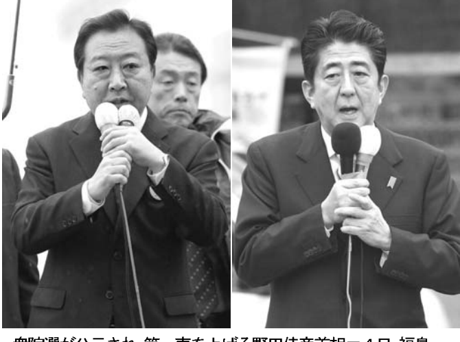
衆院選が公示され、第一声を上げる野田佳彦首相＝4日、福島県いわき市／自民党の安倍晋三総裁＝4日、福島市

【共同】第46回衆院選は4日公示され、16日の投票開票に向けて12日間の選挙戦がスタートした。原案政策の在り方や環太平洋連携協定（TPP）交渉参加の是非、消費税増税といった日本経済の左右する重要課題を争点として、民主、自民両党と日本維新の会など第三極勢力が政権の枠組みを懸けて争う。野田佳彦首相（民主党代表）は「古い自民党政権に戻すのか」と第一党維持に全力を傾注。対する自民党の安倍晋三総裁は民主党政権を「無責任」と批判し、3年3カ月ぶりの政権奪還を目指す。第三極は既成政党への不満層の支持を糾合し、政権つくりへの関与を狙う構え。激戦の行方は混沌としており、日本の行方を決める有権者の一票の意義は重い。民主党への強い逆風の中、選挙戦に突入した首相が狙うのは「比較第一党」の座。自民党より一つでも多くの議席を得て、選挙後の政権枠組みに向け発言権を確保する狙いだ。