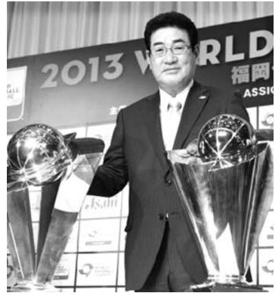
WBC日本代表候補選手の発表会見後、第1回と第2回大会の優勝トロフィーを前に記念写真に納まると監督の山本浩二

【共同】来年3月に開催される野球の国・地域別対抗戦、第3回ワールド・ベースボール・クラシック(WBC)で3連覇を狙う日本代表の山本監督は4日、代表候補34選手を発表し、阿部(巨人)や田中(楽天)、前田健(広島)らを選出した。 米大リーグ球団に所属する選手は選ばれず、国内でプレーする選手のみで構成された。投手では杉内や内海の巨人勢、今村(広島)らがメンバー入り。野手では稲葉(日