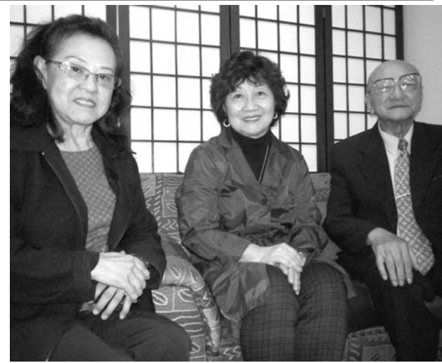
本紙を訪ね来場を呼びかけた皆さん

文協が主催する今年最後のドミコンコンサートが9日午前11時から、聖市の文協ビル(Rua Sao Joaquin, 381, Liberdade)小講堂で開かれる。 「珍しい楽器の共演」今年最後の文協ドミコン