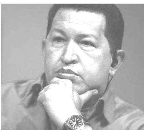
ペネズエラのチャベス大統領

大きな打撃を受けている業界は、自動車部品と食肉という、同国向けの主力2業種である。メデイロス氏によると、90日以上にわたり支払いが滞っている金額は、3千万ドル以上。問題は、通貨ボリバルが大量に流出するのを回避する目的で、2003年にペネズエラ政府が導入したCADIVIである。国際決済銀行(BIS)は2005年、CADIVIの設立を批判するとともに、それを一貫して同国の為替管理に関して輸出業者が警告を発し続けている。コンサルタント会社、パラルムホルヘ・アソシ