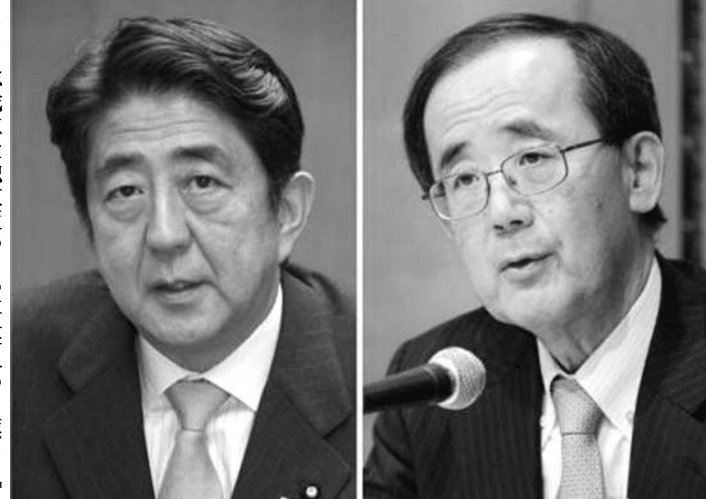
自民党の安倍晋三総裁、日銀の白川方明総裁

【共同】自民党の安倍晋三総裁は18日、日銀の白川方明総裁と東京都内の自民党本部で会談し、消費者物価で前年比2%の上昇率を達成する目標を柱とした、政策協定（アコード）を政府と日銀で結ぶと要請した。日銀は衆議院選で自民党が圧勝したことを国民の意思の表れと受け止め、安倍氏が率いる新政権とデフレ脱却に向けて協定する方針。協定締結に向けた具体的な検討に入る。日銀は19と20日に開く金融政策決定会合で物価目標を2%にする議論を本格化させ、来年1月21と22日に開く決定会合をめぐり協定締結を目指す。会談後、記者団に安倍氏は、白川総裁に対して「2%のインフレターゲット（物価上昇率の目標）に向け、日銀と政策協定を結びたい」と申し入れたことを明らかにした。