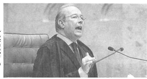
17日、最高裁でのメロ判事

17日の最高裁では、メロ判事事件で有罪となり、禁固刑を言い渡された連邦議員の罷免をめぐる投票が行われ、5対4で「罷免」の判決を下した。