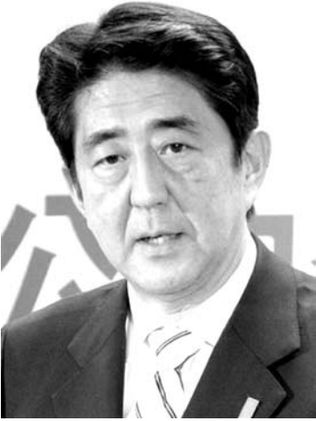
自民党の安倍晋三総裁

【共同】自民党の安倍晋三総裁(元首相)は祖父が岸信介元首相、大叔父が佐藤栄作元首相、父は晋太郎元首相という政治家一族で育った。吉田茂元首相と麻生太郎元首相は遠い親戚で、親族には著名な政治家がそろった。