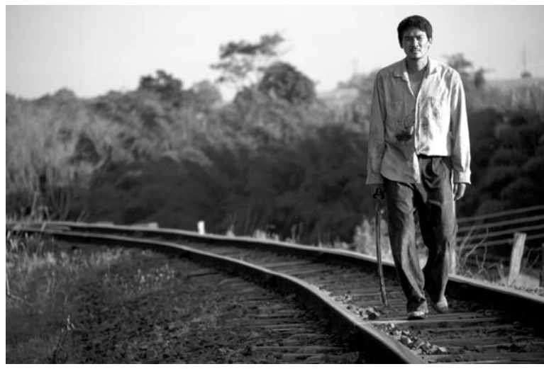
映画『汚れた心』のシーン

JICAが作成した戦後移住地の代表格、グアタバラ、ピニヤールの両移住地が、揃って入植50周年を迎えた。