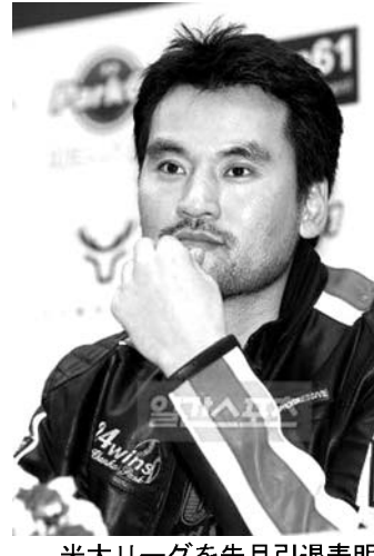
米大リーグを先月引退表明した朴賛浩

【共同】フィギュアスケートの全日本選手権で最終調整する高橋大輔（手前）と羽生結弦