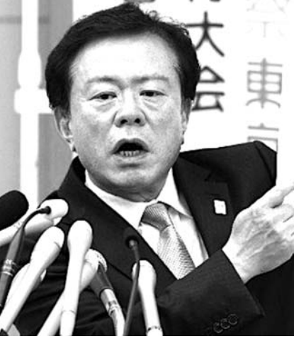
2020年東京五輪招致委員長となった猪瀬直樹都知事

【共同】2020年東京五輪招致委員会は21日、東京都庁で理事会を開き、猪瀬直樹知事を会長とする新体制を決定させた。詳細な開催計画を説明した立候補ファイナルはサッカー女子日本代表の澤穂希（INAC神戸）らが来年1月7日にスイス・ローザンヌにある国際オリンピック委員会（IOC）本部に提出する。同ファイナルはこの日の理事会で承認され、提出された。優勝候補の両選手は4回戦ジャンプを決めて好演技を期待させられた。