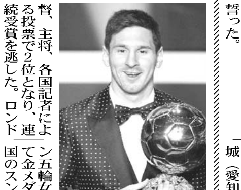
受賞後にトロフィーを持つメッシ

【共同】国際サッカー連盟（FIFA）は7日、スイスのチューリッヒで2012年の世界年間最優秀選手など各賞を発表した。男子最優秀選手（FIFAベストイレブン）にはアルゼンチン代表のFWメッシ（バルセロナ）が輝いた。FIFA最優秀選手は4年連続で受賞し、4度の受賞は史上初。 昨年、女子最優秀選手に選ばれた日本代表の佐々木則監督は、FIFA加盟協会の代表監督として、各国記者による投票で2位となり、連続受賞を逃した。ロンドン五輪女子で日本を抑えて金メダルを獲得したメッシは昨年、クラブ