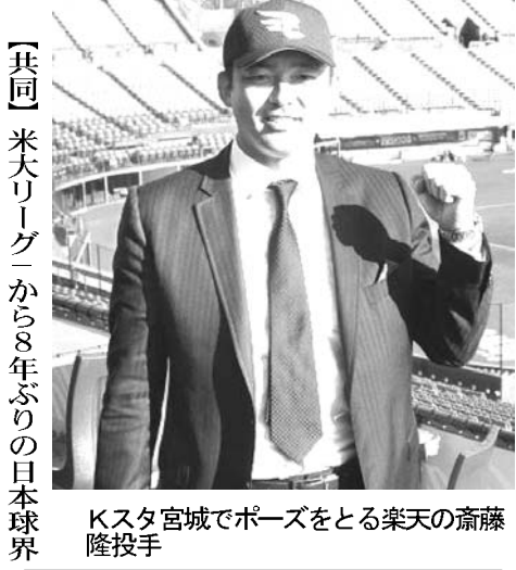
Kスタ宮城でポーズをとる楽天の斎藤隆投手